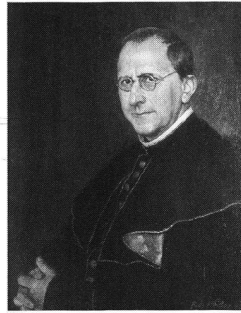
Bernhard Lichtenberg, Domprobst der Sankt-Hedwigs-Kathedrale Berlin, setzte sich für die Juden ein und wurde 1941 verhaftet. Er starb während der Überführung ins KZ an Entkräftung.

Die meisten Zeitgenossen der jüdischen Katastrophe waren weder Täter noch Opfer, sondern Zuschauer, und diesen wendet sich Hilberg am Schluss seines Buches zu. Die Zuschauer waren insofern an den Vorgängen beteiligt, als sie wahrnahmen, was vorging: Die Entlassung jüdischer Beamter, die Emigration und Deportation jüdischer Nachbarn, die Konfiskation jüdischen Besitzes – das alles war in der Tat von niemandem zu übersehen. Erstaunlich bleibt die Gleichgültigkeit, mit der die Öffentlichkeit in Deutschland, aber auch in vielen besetzten Gebieten, von diesen Vorgängen Kenntnis nahm, und zwar nicht erst nach Kriegsbeginn, als die Sorge um das Wohl der Angehörigen in den Vordergrund trat. « Wer half », schreibt Hilberg, « stand in Deutschland fast völlig allein. » Und kaum