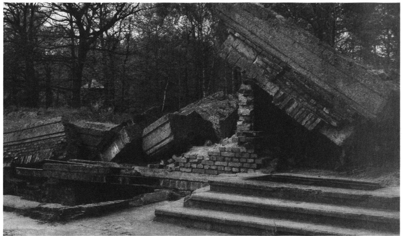
KZ Auschwitz-Birkenau: Krematorium III.

von Krockow: Sicher. Aber dann kann man dieses Datum, an dem ja auch 1918/19 die Revolution gegen das Kaiserreich einsetzte, zum Nachdenken über Deutschland nehmen. Die Überschneidung mit problematischen Daten der deutschen Geschichte könnte ja von vorneherein Entwicklungen entgegenwirken, den Nationalfeiertag wieder so zu gebrauchen, dass wir Deutschen uns alle gegenseitig auf die Schultern klopfen und uns wieder hervorragend, hervorragender als andere finden. Wir Deutschen brauchen nicht mehr diesen Hurra-Patriotismus des 19. Jahrhunderts. Mit Bezug auf die Revolution in der früheren DDR könnte man dann sogar sagen: Von der Revolution her ist unsere neue Einheit, unser Gemeinwesen begründet. Irgendwann muss es in jedem Land einmal gelingen, dass man einen König köpft oder vertreibt oder die Obrigkeit abschafft – so war es in England, der Schweiz, in Frankreich ebenso wie in den USA. Überall hat man da seine Symbole her, und hier hätten wir nun die Gelegenheit. Das wäre zugleich ein Zeichen gegen all das, was rechtsradikal ist. Ich habe manchmal das Gefühl, dass noch der Untertan in uns steckt und wir uns sagen: Wir haben Obrigkeit in Deutschland verjagt, aber das gehört sich eigentlich nicht. Als ob wir das wieder verdrängen wollten und es dadurch gutzumachen versuchen, dass wir den 3. Oktober nehmen. So nach dem Motto, das war doch brav und anständig, was der Herr Schäuble und der Herr Krause mit ihren Experten gemacht haben.