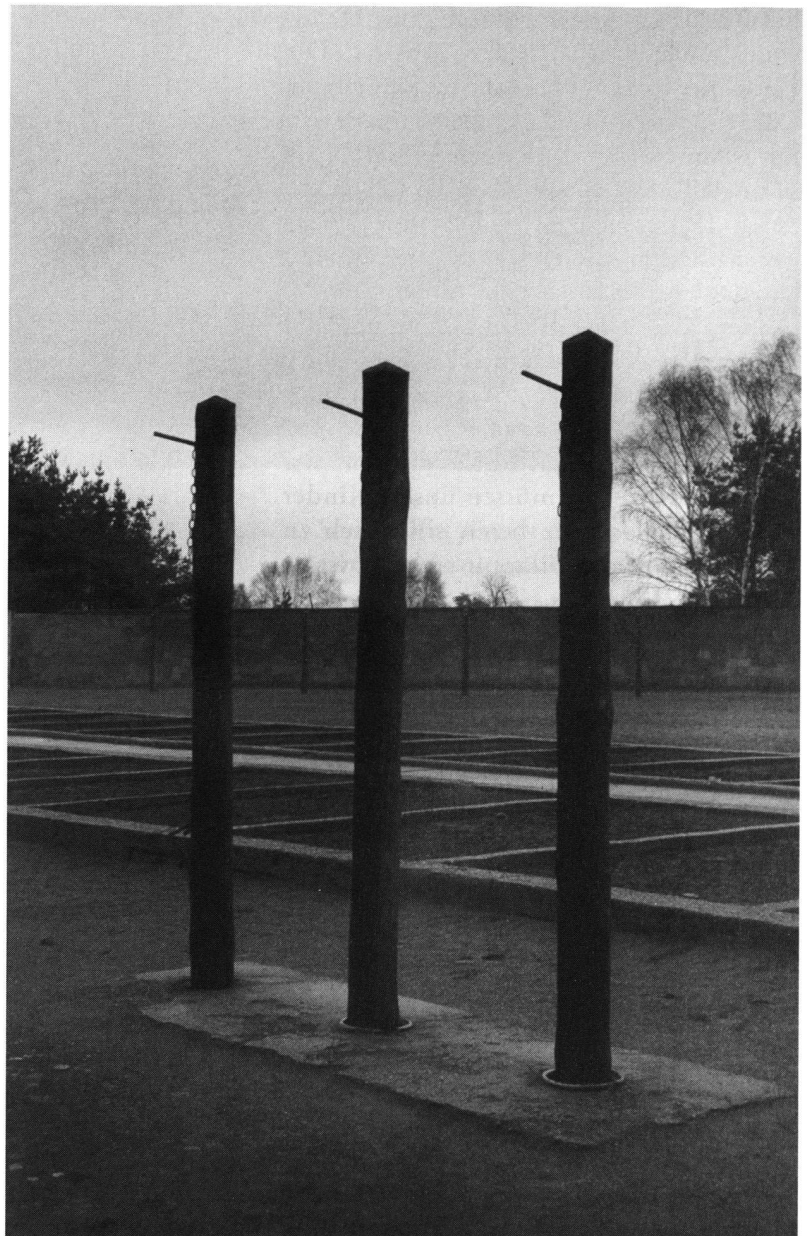
KZ Sachsenhausen: Pfähle, an denen Häftlinge mit nach hinten gedrehten Armen aufgehängt wurden. Im Hintergrund Fundamente des Zellenbaues.

von Krockow: Zunächst einmal denke ich, ist das oft ein Zufall. Man kann ja nichts dafür, wo man geboren wird, welches Elternhaus man hat. Ich bin in einer Welt gross geworden, die sehr preussisch