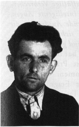
Johann Georg Elser 1903–1945