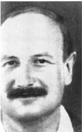
Albrecht Haushofer 1903–1945

Während in Frankreich die «Résistance» ihren eigenen glorifizierenden Mythos pflegt und bis heute den heterogenen Kreis ihrer Märtyrer feiert, gibt der facettenreiche Widerstand gegen Hitler in Deutschland Anlass zu Verlegenheit, zu Missverständnissen und Meinungsverschiedenheiten. Drei Autoren porträtieren aus verschiedenen Blickwinkeln Albrecht Haushofer, Georg Elser und Edgar J. Jung.