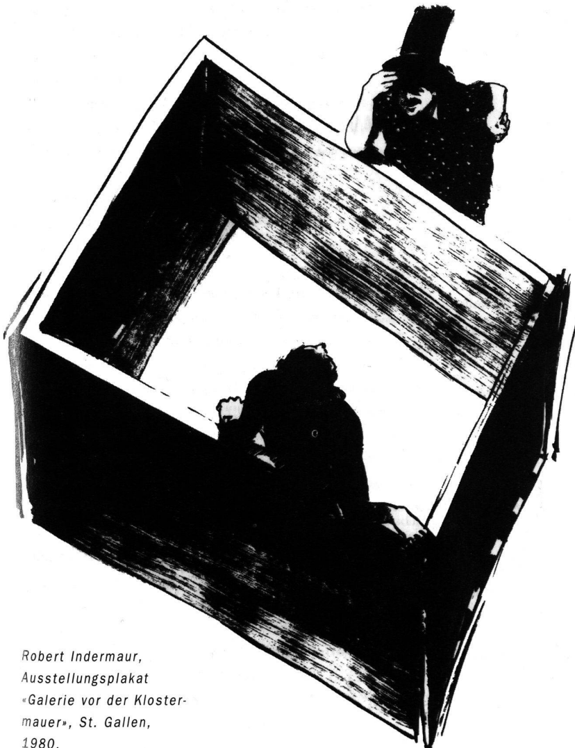
Robert Indermaur, Ausstellungsplakat «Galerie vor der Kloster- mauer», St. Gallen, 1980.

Auch auf andern Teilen des Kontinents gibt es verdrängte und nur mit Mühe unterdrückte nationale und ethnische Konflikte. Im zersplitterten und polyzentrischen Europa könnten diese zu einem