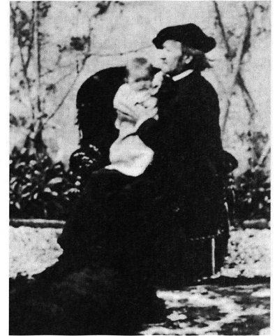
Richard Wagner mit Tochter Eva in Tribschen LU.

Ganz besonders aber gehen Schopenhauer Wagners Substantiv-Komposita gegen den Strich, und hier wird es ernst: Es wird eine Kritik formuliert, die den Dichter und den Musiker zugleich trifft, und zwar tödlich. In der Regieanweisung zum dritten Akt der «Walküre» unterstreicht er «Tannenwald» , «Felsöhle» , «Felssteine» , «Felsensaume» , «Felsspitze» , schreibt zweimal ein «So» an den Rand, mit Ausrufungszeichen bzw.