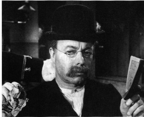
Der Hauptmann von Köpenick (Heinz Rühmann).

Unmittelbare Konsequenz dieser Erfolglosigkeit war Carl Zuckmayers Rückzug auf eine Mithilfe auf Dorothy Thompson gepachteten Farm in Vermont. Hier arbeiteten die Zuckmayers als Farmer – auch wenn die Aussage Carl Zuckmayers, er habe die Farm die ersten zweieinhalb Jahre nicht verlassen, nicht zutrifft. Denn natürlich bemühte sich der Schriftsteller auch in diesen Jahren nicht nur um Tiere, Pflanzen, Feuermachen und Holzhacken, sondern auch um die Rettung gefährdeter