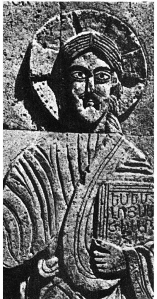
Armenisches Flachrelief (Christusgestalt) an der Aussenwand der Klosterkirche auf der Insel Achthamar, erbaut im 10. Jahrhundert von König Gagik I.

er an den Rand: «Nicht gegen die Türken polemisieren» . Und der Verleger doppelte nach, indem er am 20. November 1933 an den türkischen Gesandten in Wien schrieb: «Obwohl das Buch sich gegen die Armenierverfolgungen wendet, die seinerzeit von den Jungtürken organisiert worden sind, glaube ich dennoch, dass es Franz Werfel gelungen ist, unparteiisch zu sein, indem er in seiner Menschengestaltung auf beiden Seiten Figuren geschaffen hat, die alle Vorzüge der Nationen in sich vereinigen. So glaube ich, dass er (...) den türkischen Menschen in einer Weise in die europäische Literatur eingeführt hat, wie er bisher noch nie geschildert worden ist.» Wenn Werfel im Brief an die Eltern vom März 1933 betont, er lebe ganz «im Armenier-Schicksal» , so macht er deutlich, dass er den Roman, an dem er monatelang fast ununterbrochen arbeitete, aus der Perspektive der bedrohten Minderheit schreiben wollte, das Schicksal des jüdischen Volkes, dem er angehörte, vor Augen. Gerade dieser Standpunkt wird ihm von türkischen