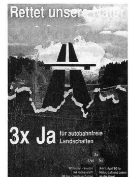
Abstimmungsplakat für die Kleeblattinitiative, 1990.

Viele mit der Mobilität einhergehende Probleme machen nicht an den nationalen Grenzen Halt. Die für nationale oder gar lokale öffentliche Güter typischen Lösungsmuster greifen daher zu kurz. Während sich im nationalen Raum externe Effekte grundsätzlich internalisieren lassen, fehlt im internationalen Diskurs eine staatsähnliche, mit Vollzugsgewalt ausgestattete Instanz.