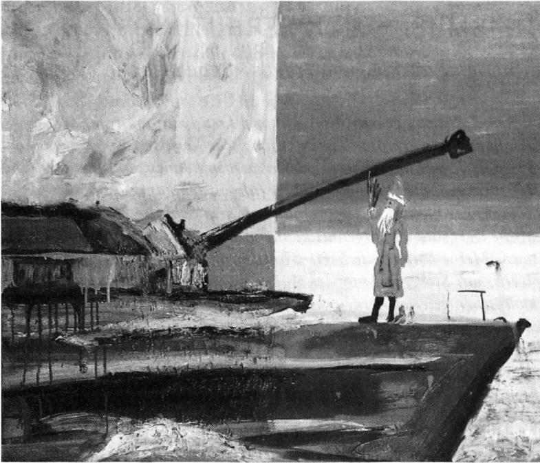
Martin Kippenberger, «Krieg böse» 1983, Öl, 100 x 120.