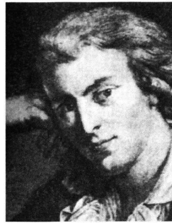
Friedrich von Schiller

Das Schöpferische im Bereich des Wahren, Schönen und Guten ist grenzenlos of-