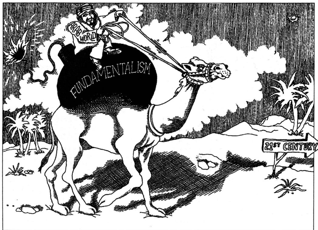
Aus: Time Magazine

«Einst wollte jedermann Mitglied bei den MUSLIM-BRÜDERN sein, doch dann sagten sich alle jungen Leute von ihnen los und schlossen sich anderen Gruppen an. Die MUSLIM-BRÜDER waren naiv genug, die Regierung zu unterstützen und sich an den Gewerkschaften, Gemeindeverwaltungen usw. zu beteiligen. Als die Regierung