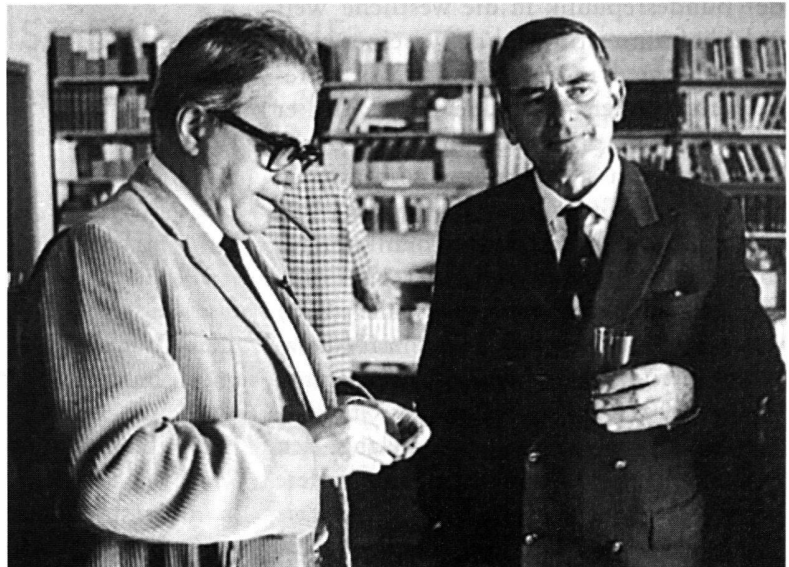
Golo Mann (rechts) und Max Frisch an einer Tagung der Gruppe 47 in Rüschlikon 1968.

Freundes Raymond Aron während der Pariser Mai-Unruhen erinnert. Dass Golo Mann nicht schwieg, als Teile der «ausserparlamentarischen Opposition» in den siebziger Jahren in den Terrorismus abtauchten und zu Attentaten auf prominente Persönlichkeiten schritten, erstaunt nicht. Die politischen Mörder, stellte er 1977 in einem viel beachteten Artikel in der «Welt» fest, hätten ihre Grundrechte verwirkt 16 ; und im selben Jahr doppelte er am selben Ort mit einem Artikel unter dem Cicero-Zitat «Quo usque tandem?» nach, in dem er, nun freilich dramatisierend, feststellte, Deutschland stehe in einem Bürgerkrieg, dem die staatliche Gewalt mit allen Mitteln entgegenzutreten müsse 17 . Für die engagierte Kritik an der politischen Ideologie der Studentenbewegung und den vehementen Protest gegen die Aktionen der «Rote Armee Fraktion» zahlte der Autor seinen Preis: Während Jahren konnte Golo Mann an deutschen Universitäten nicht mehr auftreten – man hätte ihn nicht zu Wort kommen lassen 18 . Als der Historiker im Februar 1987 an der Gedenkfeier zum 150. Todestag Georg Büchners in der vollbesetzten Aula der Universität Zürich sprach, hatten sich die Wellen geglättet 19 .