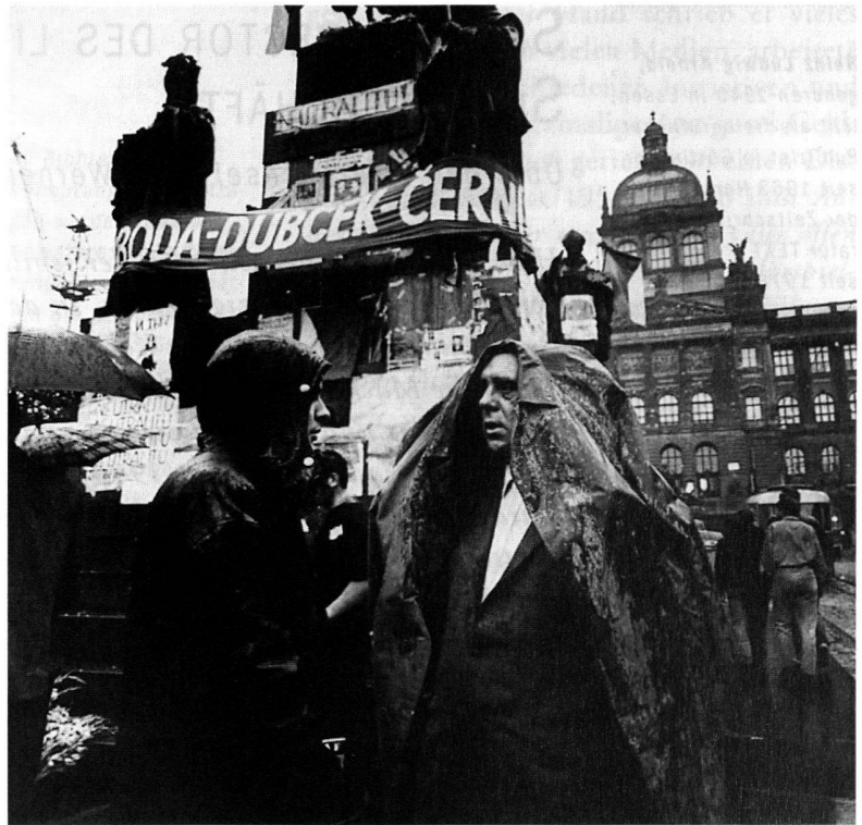
Betroffen am Prager Wenzelsplatz nach dem sowjetischen Einmarsch: Heinrich Böll.

Einige Literaten reden von 1969 an freilich schon vom «Schiffbruch» – eine Metapher,