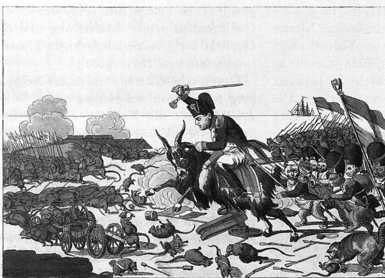
Die grösste Heldenthat des neunzehnten Jahrhunderts oder Eroberung der Insel Helena.

Johann Michael Voltz? 1815, Radierung, koloriert. Herkunft unbekannt (aus dem besprochenen Band).