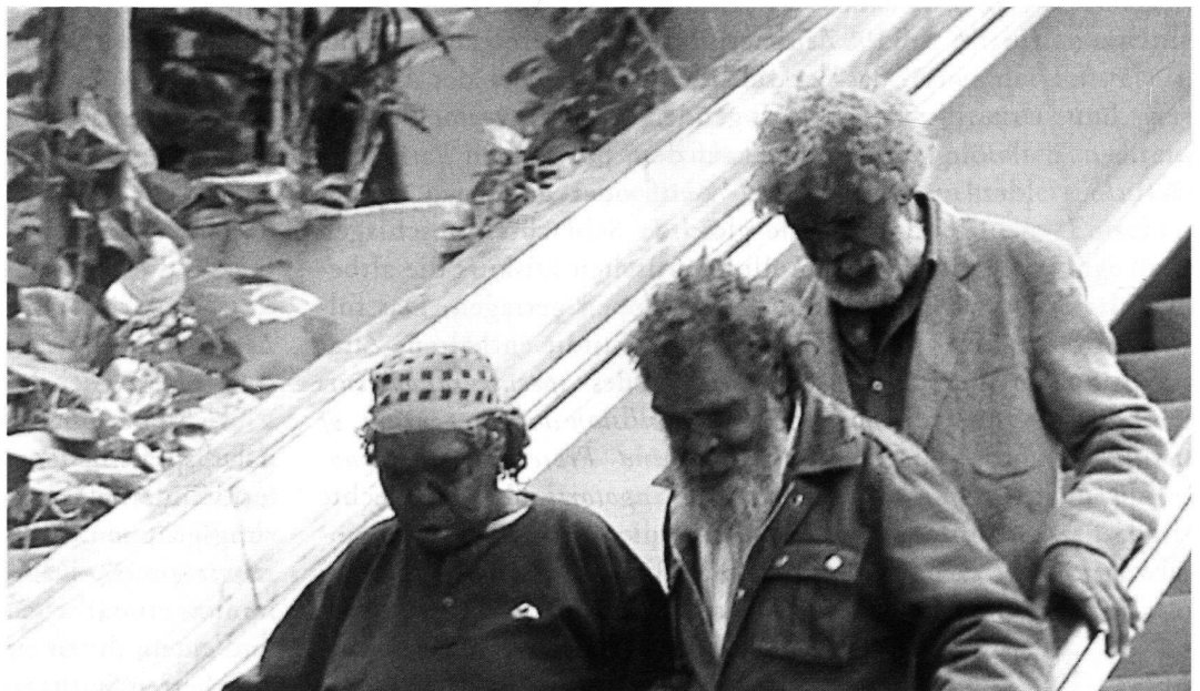
Australische Aborigines im Supermarkt, aus: Hans Küng, Spurensuche. Die Weltreligionen auf dem Weg . Piper München 1999.

Die einzig freie Entscheidung eines Mitglieds einer ethnischen Gemeinschaft ist der Austritt aus oder der Wiedereintritt in den eingeborenen Verband, sowie der Beitritt zu einer dort oder anderswo begründeten religiösen Gemeinde. Jeder Mensch wird frei und, mit seiner individuellen Würde geboren, jedoch ohne Religion. Die Verquickung religiöser Minderheiten mit den oben genannten ist sicher mit ein gewichtiger Grund für das Durcheinander bei der nicht zu leugnenden Tatsache, dass sprachliche, nationale, regionale, autochthone, indigene oder eben kulturelle Minderheiten in Wahrheit Völker, Volksgruppen oder (als kleinste Einheit) Stämme sind. Das Schicksal der Basken demonstriert, wie durch eine einst willkürlich gezogene Grenze zweier Nationalstaaten aus einer Volksgruppe zwei (ethnische) Minderheiten werden. Und Exempel demonstrieren dann ebenso, warum die EU z. B. auf dem Balkan nicht zu einer Frieden stiftenden Lösung finden kann. Und auch die Uno versagt da kläglich, obwohl sie doch angeblich global «im