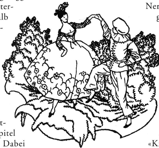
Karl Walser, Tanzillustration (1906)