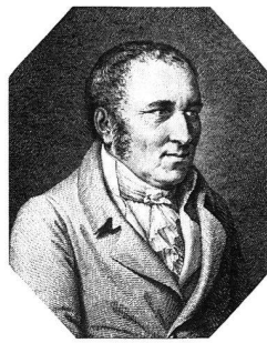
Johann Peter Hebel 1760–1826

Exemplarisch für Hebels Dichtkunst in alemannischem Dialekt sei das lange Gedicht von der « Wiese », dem Fluss der Markgräfler Heimat, genannt. Aus der weiten Ferne der Residenzstadt Karlsruhe besingt der alemannische Professor am klassischen Gymnasium den heimatlichen Bach im Wiesental, er beschreibt allegorisch gekonnt die « Wiese » als eine weibliche Person, die an der Quelle im Südschwarzwald « geboren » wird, heranwächst, immer grösser und breiter wird, bis sie zuletzt, als dichterisch verklärte Person, als ein einer griechischen Göttin ähnliches Wesen, schliesslich ihrem vorherbestimmten Bräutigam, dem Rhein, entgegeneilt, um sich mit dem grossen Strom zu vermählen und zu vereinigen. Und Hebel besingt diese « Wiese » als ein Liebender, als einer, der alles weiss von der Geliebten,