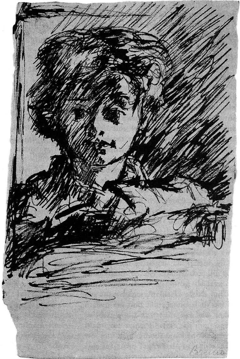
Giovanni Giacometti. Bruno, um 1912, Feder, 24 x 15,5 cm, Privatbesitz.

Auffallend bei den von Ihnen entworfenen Häusern und Gebäuden – dem Schulhaus in Stampa etwa oder die beiden Wohnhäuser für Zollbeamte im Bergell – ist der Gebrauch von Holz und Steinmaterial der unmittelbaren Umgebung und auch ein sehr platzsparendes Bauen.