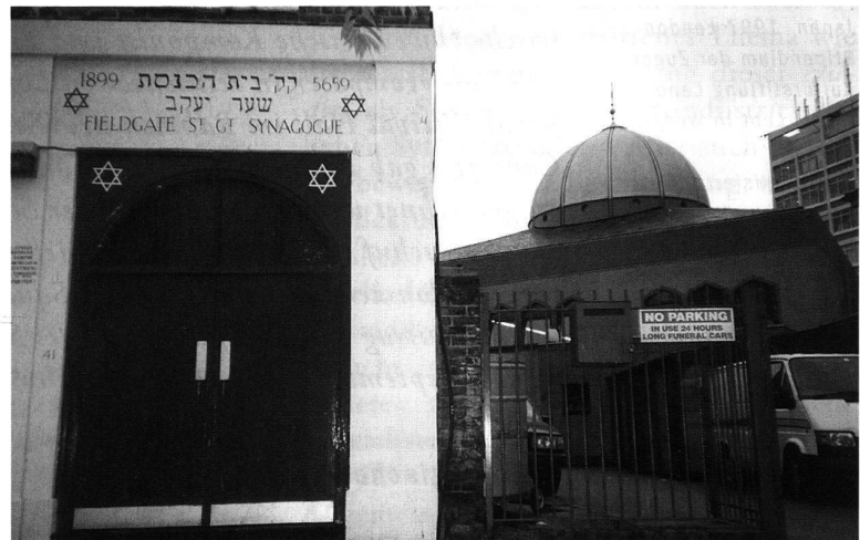
Die grosse «East London»-Moschee an der Whitechapel Street, an die auf der Hinterseite übergangslos die Fieldgate Street-Synagoge anschliesst, ist an eine Citroën-Garage angebaut, so dass die Stimme des Muezzins vom Minarett über der smogroten Sonne und der rotweissen Doppelraute erschallt.

teile Ostpakistan und Westpakistan. Der Name «Pakistan» entstand übrigens aus der realpolitischen Retorte: P für Punjab, a für Afghan, ki für Kaschmir, s für Sind und tan für Belutschistan. 1971 erklärte sich der östliche Teil als Republik Bangladesh unabhängig. Ein grosser Teil der Flüchtlinge ging nach Indien, ein kleinerer nach London: Das sind allerdings immer noch einige Zehntausend.