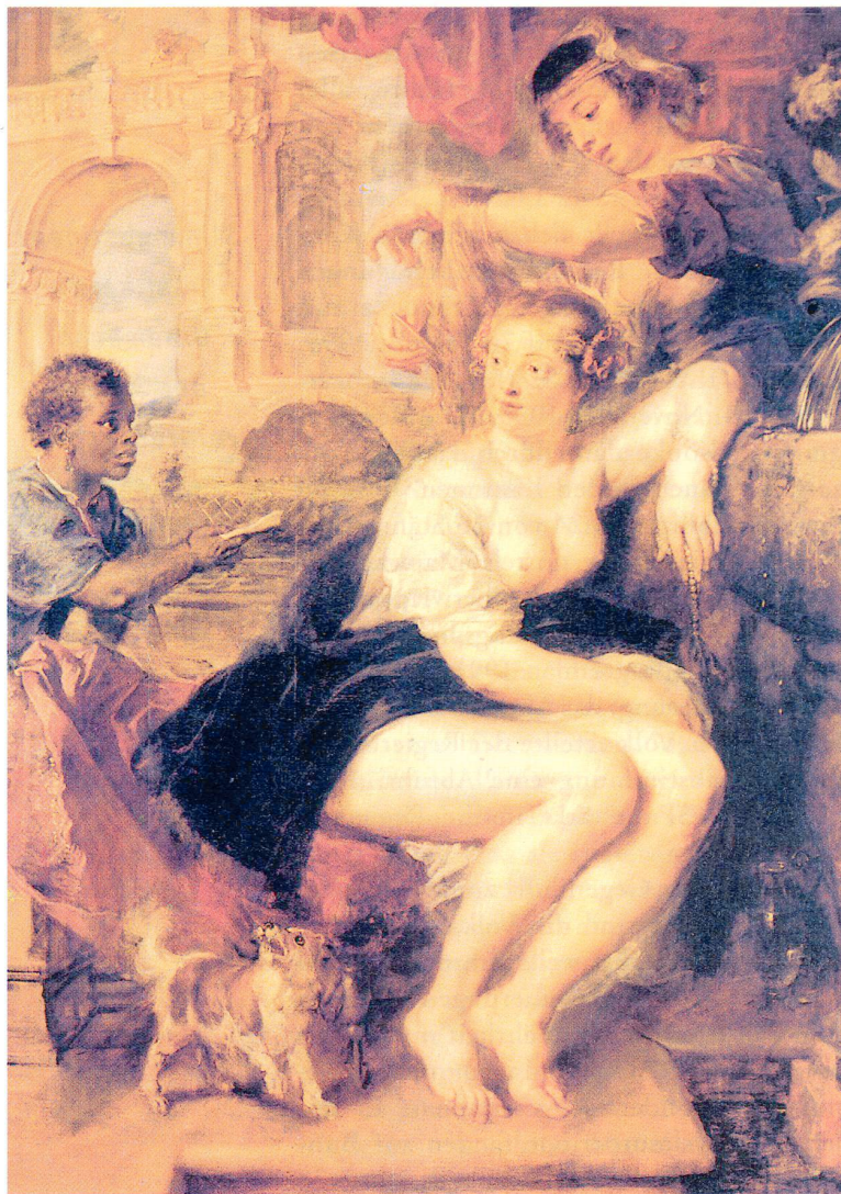
Peter Paul Rubens (1577–1640), Bathseba am Springbrunnen , Öl auf Leinwand, Gemäldegalerie Dresden.

Es gibt auch Gegenindizien zur Vertrauenskrise, beispielsweise die Wähleranteile der Regierungsparteien. Von 1959 bis 1991 sank er von 85 Prozent auf den Tiefstpunkt von 70 Prozent. Man glaubte allgemein an einen unaufhaltsamen Schrumpfungsprozess der Regierungsparteien und interpretierte das Phänomen als Indiz für das langsame Absterben der Konkordanz. Doch bei den Nationalratswahlen 1995 trat überraschend eine Trendwende ein. Das Stimmungsbarometer stieg auf 74 Prozent, 1999 sogar auf 81 Prozent. Das schlug sich verstärkt in den Mandatsanteilen der Bundesratsparteien nieder. Mit 86,5 Prozent im Nationalrat, 100 Prozent im Ständerat und 89 Prozent in der Vereinigten Bundesversammlung übertrifft der Mandatsanteil insgesamt in der laufenden Legislaturperiode sogar das Spitzenresultat von 1959. Im internationalen Vergleich ist