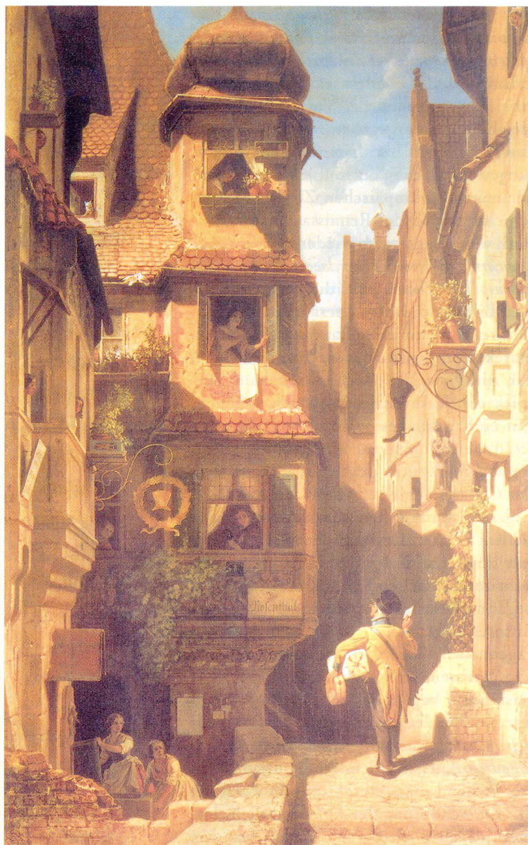
Carl Spitzweg, Der Briefbote in Rosenthal (um 1858), Öl auf Leinwand, Marburg, Universitätsmuseum für Kunst- und Kulturgeschichte.

Derrida argumentiert in der Tat sehr idealtypisch. Er stellt den Logozentrismus in radikalster Form in Frage und stiess damit vor allem in Deutschland auf Ablehnung, weil er sich gegen eine Jahrhunderte lang geltende Tradition wendete. Er geht von der bereits erwähnten kabbalistischen Vorstellung aus, dass im Judentum die Welt aus Schriftzeichen entstand, die Schrift zuerst da war, also das Primat besitzt. In der Tat hat heute in den abendländischen Gesellschaften jedes geschriebene Wort seinen Garanten. Alle Texte werden signiert. Und auch bei nicht-signierten Schriftstücken gibt es Elemente, die auf eine Diskursquelle verweisen. Des-