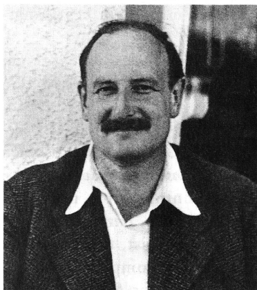
Albrecht Haushofer (1903–1945)