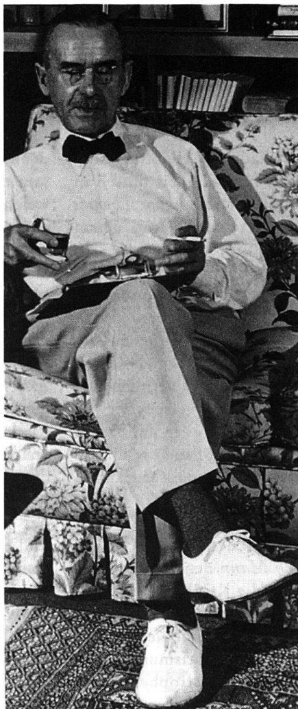
Thomas Mann in Pacific Palisades, 1947

Meyers Buch besitzt die eindruckliche Qualität eines vorbehaltlosen, unaufgeregten Umgangs mit Thomas Mann . In der Tat hat wohl erst die Verfügbarkeit des gesamten Tagebuchkorpus' diesen Umgang möglich gemacht. Thomas Manns naive po-