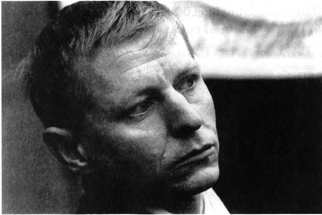
Hans Magnus Enzensberger, 1968.

Namen nennt. Jedenfalls nicht in seinen Gedichten.