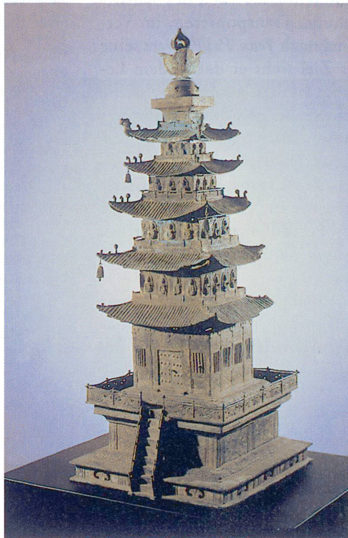
Zu Fünfstöckige Bronzepagode, Koryo-Periode, 10.–11. Jh., Bronze mit Vergoldung, aus dem Kaet'ae-Tempel, Nonsan, Ho-Am Kunstmuseum, Yong'in (aus der Ausstellung im Museum Rietberg).

Der Mensch, der sich in der veränderten Lebenswirklichkeit ganz und gar nicht zurechtfindet, ist im vorliegenden Sammelband eher die Ausnahme. Selbst der Satz eines Krematoriumsangestellten: «Es ist alles erledigt», der einem Manne die Asche seiner Gattin übergibt, verliert am Schluss seine Härte. Auf Wunsch der Frau streut der Gatte die Asche auf einer Bergspitze in den Wind, und im gleichen Moment vernimmt er, einer Halluzination gleich, den Flügelschlag eines Bergvogels. «Es war, als ob in dieser Sekunde die Seele entwichen wäre.» Die Seele ist aufgehoben im Wind, in der Natur, genau so wie sie aufgehoben ist in der Gedanken- und Gefühlswelt des Gatten. Es gibt keine verlorenen Seelen. Uralt ist das Wissen im Fernen Osten, dass die Abgeschiedenen immer irgendwie präsent sind. Die Termini Schamanismus, Taoismus hängen mit dieser Vorstellung zusammen. Han Sungweon , ein Zeitgenosse von Chông-Jun Yi hält in seiner Erzählung «Die kleine Schamanin» fest: «Meine Arbeit als Schriftsteller ist eigentlich nichts anderes als eine Art Schamanen-