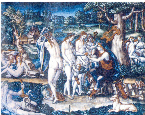
Pierre Courteys (ca. 1520–1591) «Das Urteil des Paris». Email auf Kupfer, 43 x 54 cm

Zu Titelbild und Illustration des Dossiers