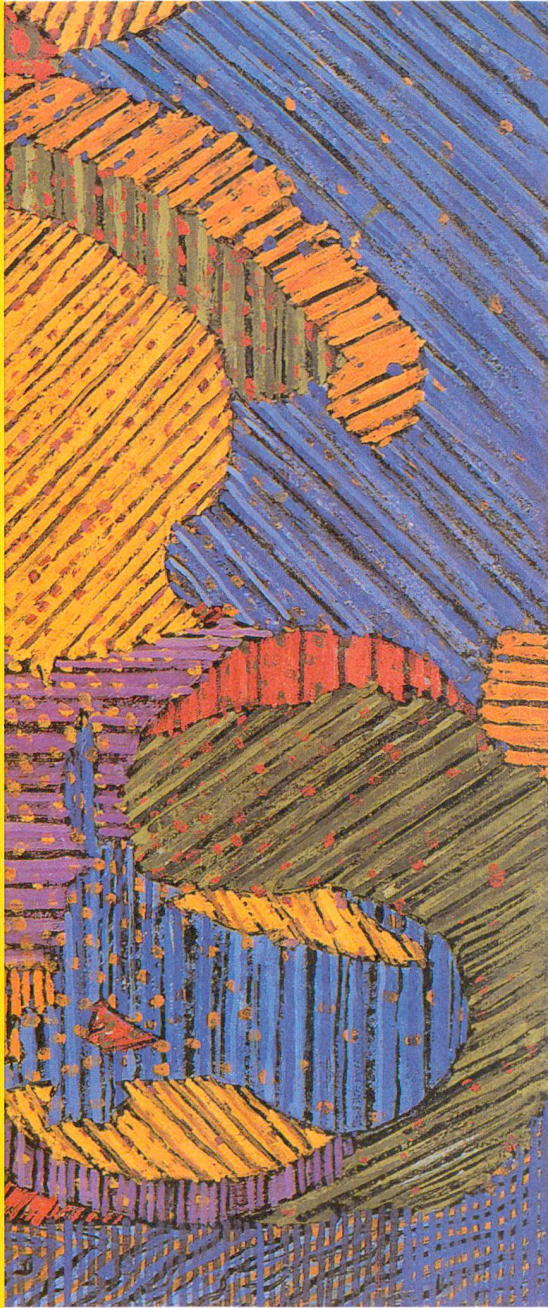
...iten zwischen Liebe und Hass