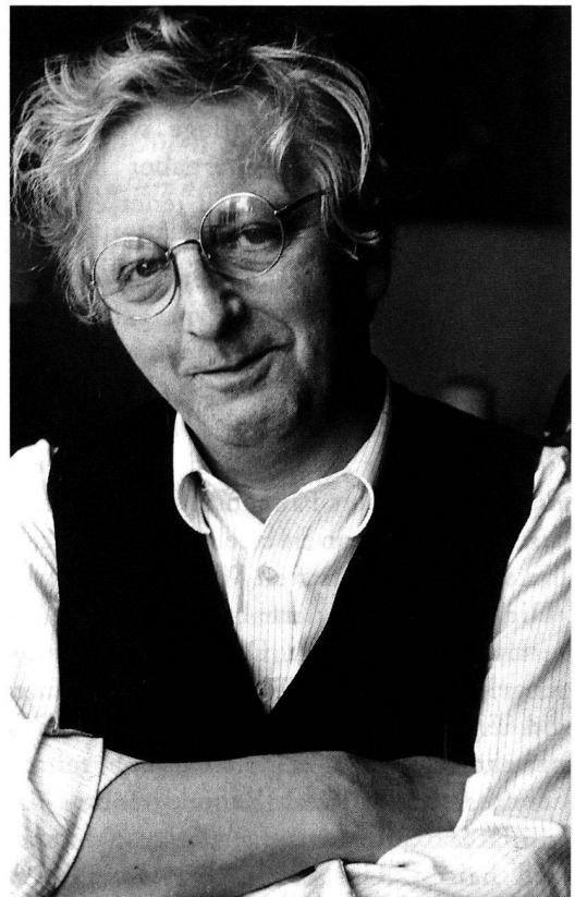
Peter Bichsel.

Wenn es dieser Autor aber ganz bunt treibt, mischt er die Vorstellung von der Wirklichkeit und die wirkliche Wirklichkeit untereinander. Im Prosastückchen «Blumen» erweist er sich als kühner Dramaturg, der fortwährend den Vorhang auf- und zuzieht. Der Text beginnt idyllisch: «Dann stellte er sie sich in einem Blumenladen vor, mit grüner Schürze und Nelkenlächeln, er würde eintreten und fragen, ob es hier Blumen zu kaufen gebe und sie würde erschrecken und lächeln und sagen: «Fast nur Blumen», und er würde auch lächeln» . Wer jetzt meint, Bichsel würde eine süsse Fräuleinsgeschichte entwerfen, täuscht sich schon wieder. Kaum haben sich Frau und Mann im Indikativ eingerichtet, fällt blitzschnell der Vorhang – und von jetzt an darf sich die Frau nur noch vorstellen, was der Mann zu ihr sagen würde; sie versucht mit allen Mitteln telepathischer Kunst,