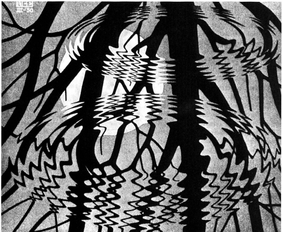
Gekräuseltes Wasser, von M.C. Escher (Linolschnitt, 1950).

Die Naturwissenschaften wurden während langer Zeit stark geprägt von einem mechanistischen Weltbild. In der Atomphysik des 20. Jahrhunderts ist diese Auffassung in den Hintergrund getreten. «Die so genannten Atome sind gerade nicht kleine