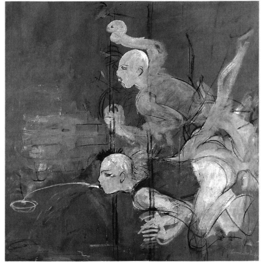
Mario Comensoli, Narziss, 1985.

Das Resignative und Forcierte, das bisweilen abtossend Aggressive und Böse kommt durchweg knapp und direkt zur Sprache. Viele entscheidende Einzelheiten werden nur in Form von Nebensätzen erwähnt, vieles bleibt unkommentiert stehen und hinterlässt auf diese Weise eine Leere, die auch den Leser verletzt. Es handelt sich, wie der Klappentext verspricht, um ein Psychogramm einer Geschwisterbeziehung, die stringent und sehr genau analysiert wird, dies aber unter Verzicht auf psychoanalytisches Vokabular, explizite Erklärungen und Bewertungen. Bis zum Schluss wird kein konkreter Vorwurf ausgesprochen – eine Strategie, die den grossen Vorwurf dahinter umso deutlicher hervortreten lässt.