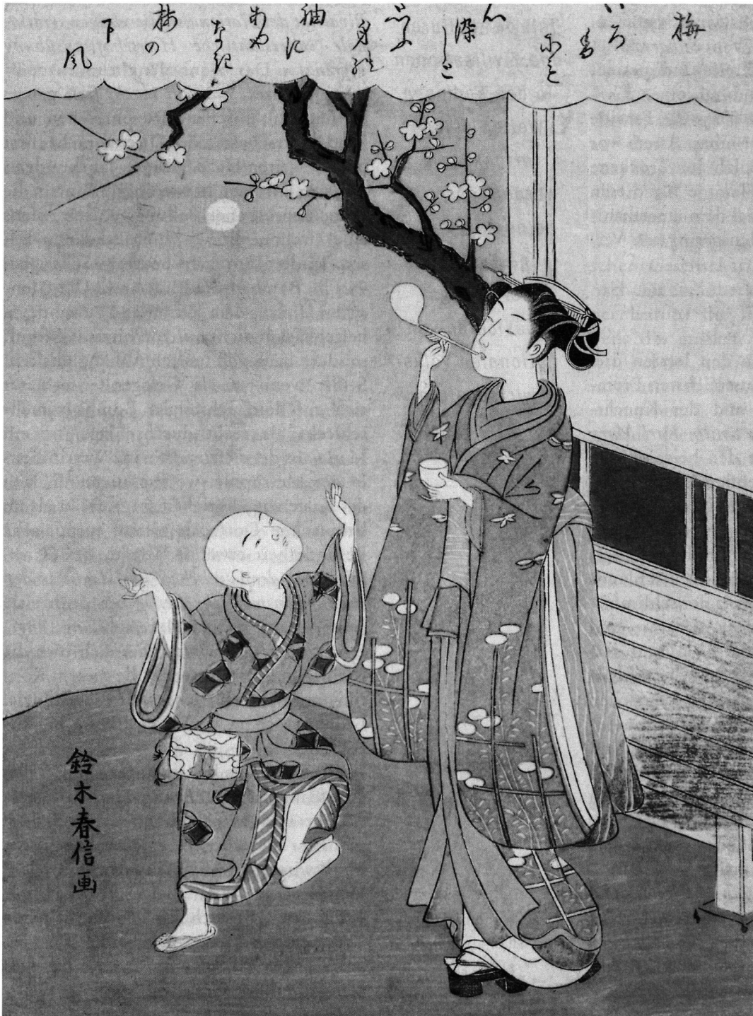
Suzuki Harunobu (1725?–1770). Pflaumenblüten, Farbholzschnitt um 1768. Geschenk Julius Mueller (ehemals Sammlung Heinz Brasch).

und Inflationsraten etwas inhaltlich Relevantes auszusagen. Weede weiss, dass im Falle Indiens das hinduistische Kastensystem, im Falle Chinas die Prinzipien des Konfuzianismus und im Falle Japans der sicherheitspolitische Hintergrund der Meiji Restauration das sine qua non für eine umfassende Bewertung der wirtschaftlichen Entwicklung in der Vergangenheit und der Aussichten für die Zukunft sind. Überall, vom Vorderen Orient bis zum fernsten Osten der koreanischen Halbinsel, ist ohne Kenntnis der Ge-