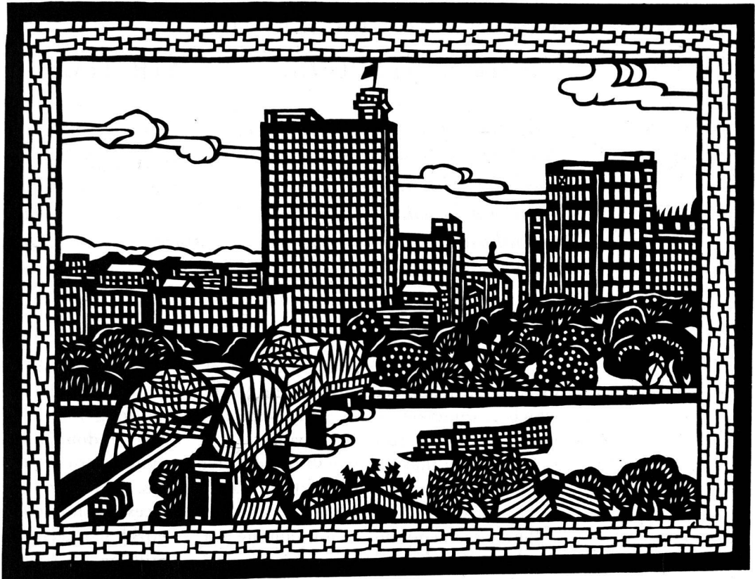
Ansicht der Stadt Canton. Scherenschnitt aus den Achtzigerjahren.

The real challenge to the Chinese economy will be in the medium term after the expiration of the grace period and before the completion of the Chinese economy's adjustments to long-term equilibrium.