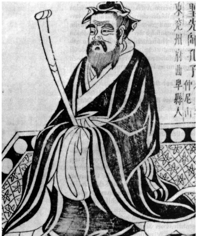
Portrait des Konfuzius; Herkunft unbekannt

(das «Wesen») des Menschen ausmacht. Auch wer es mit Verbrechern zu tun hat, so zumindest die implizite Schlussfolgerung, sollte diese «wahre Natur» nicht aus dem Blick verlieren und in seinen Sanktionen berücksichtigen.