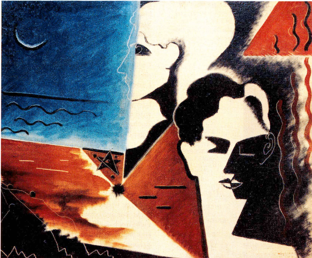
Le matin , 1929, Öl auf Leinwand, 54 x 61 cm, Privatbesitz.