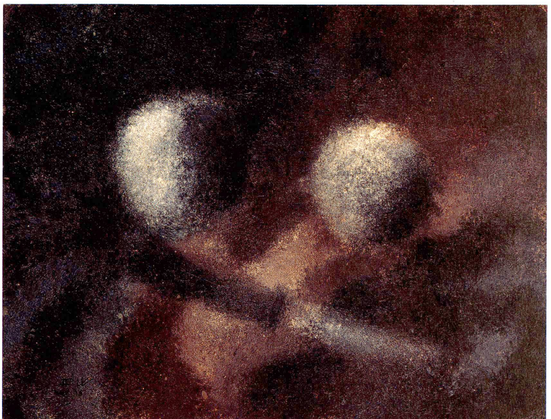
Ohne Titel (Nature morte) , 1928, Öl auf Karton, 27 x 34,8 cm, Privatbesitz.