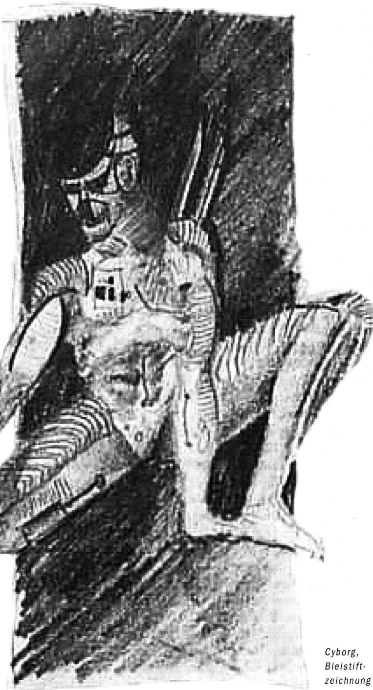
Cyborg, Bleistift- zeichnung

schreiben. Einen entscheidenden Schritt in dieser Richtung tat er 1921 mit seiner Rede «Von deutscher Republik», in der er