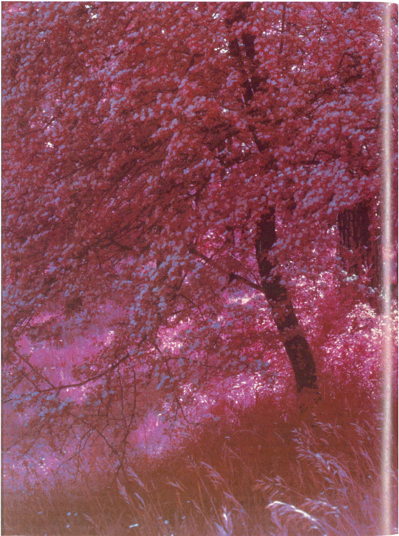
Simone Kappeler, «Immenberg, 23. Mai 1998», Ilfochrome, aus der Serie «Mittag schattenlos». www.simonekappeler.com