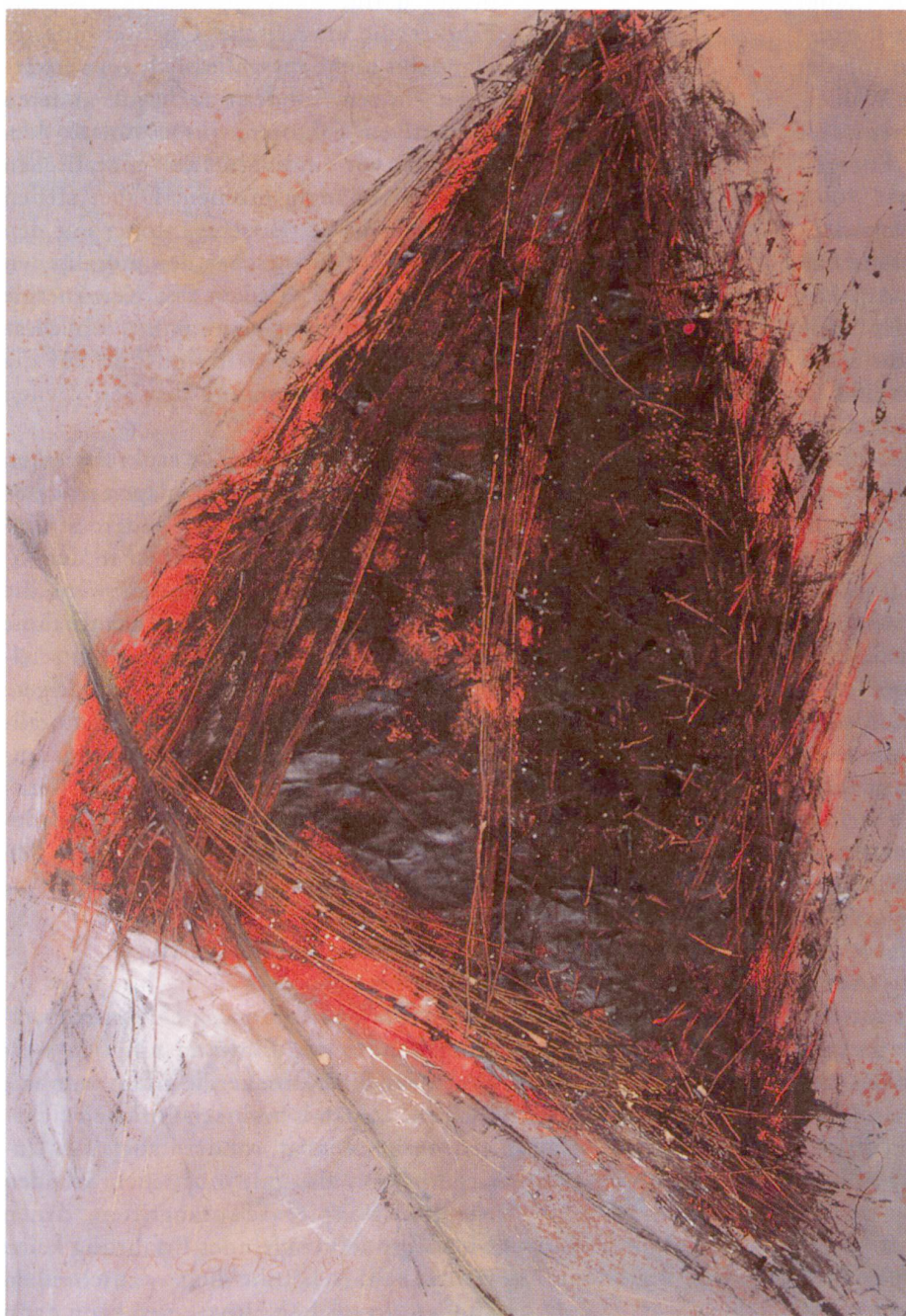
Ursula Goetz-Wiederkehr, «Dreieck», Mischtechnik, 1987, 90 x 130 cm