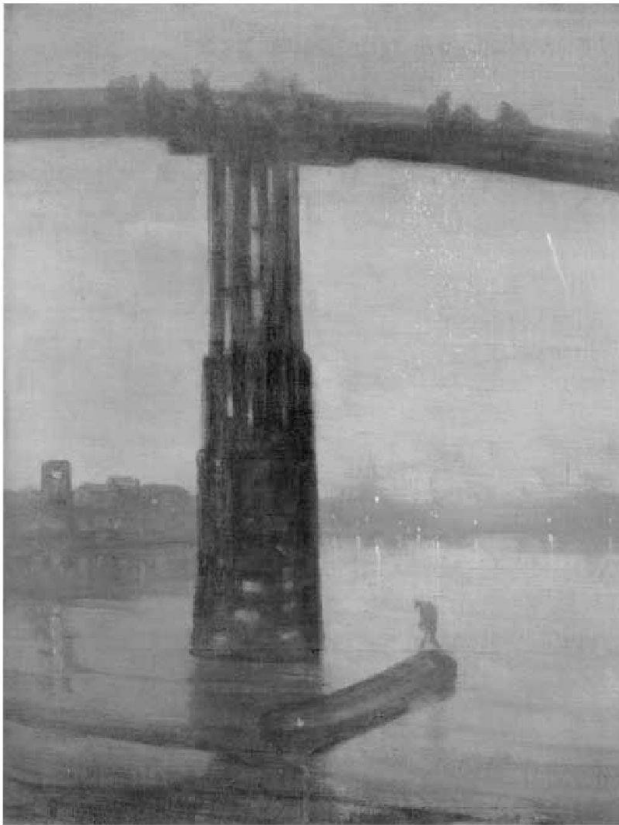
James A. M. Whistler, «Nocturne: Blue and Gold – Old Battersea Bridge», 1873

lektuellen Gehalt symbolisiert, der mit dem anschaulich Gegebenen nur die Regel der Reflexion gemeinsam hat, der mit dem Gegebenen also in der engen Beziehung einer Analogie steht, ist hochbedeutsam. Bei den Werken der Bildenden Kunst darf danach in der ästhetischen Deutung nicht mehr der dargestellte Gegenstand mit dem Wissen vom Gegenstand verglichen werden. Die Schönheit des Kunstwerks ist nur von der kreativen Konstruktion im sinnlichen Material abhängig – von einer Konstruktion, die durch Analogie ein Intelligibles zur Erscheinung bringt. Dieses Intelligible ist – und dessen positive Bestimmung ist wieder Kant zu verdanken – der Gedanke, dass die subjektiven Kompetenzen und ihre besondere Zusammenstimmung das Wissen von der Welt und von der vernünftige Weltordnung bedingen.