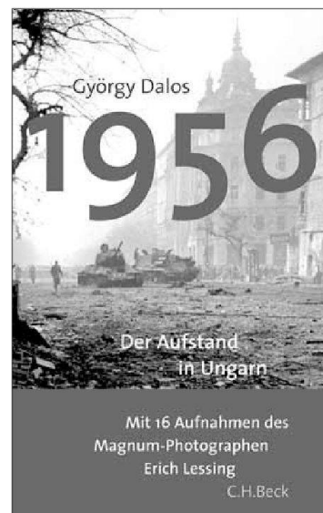
György Dalos, 1956. Der Aufstand in Ungarn. 246 Seiten, 17 Abbildungen, Gebunden. sFr 34.10 / EUR 19.40[D]