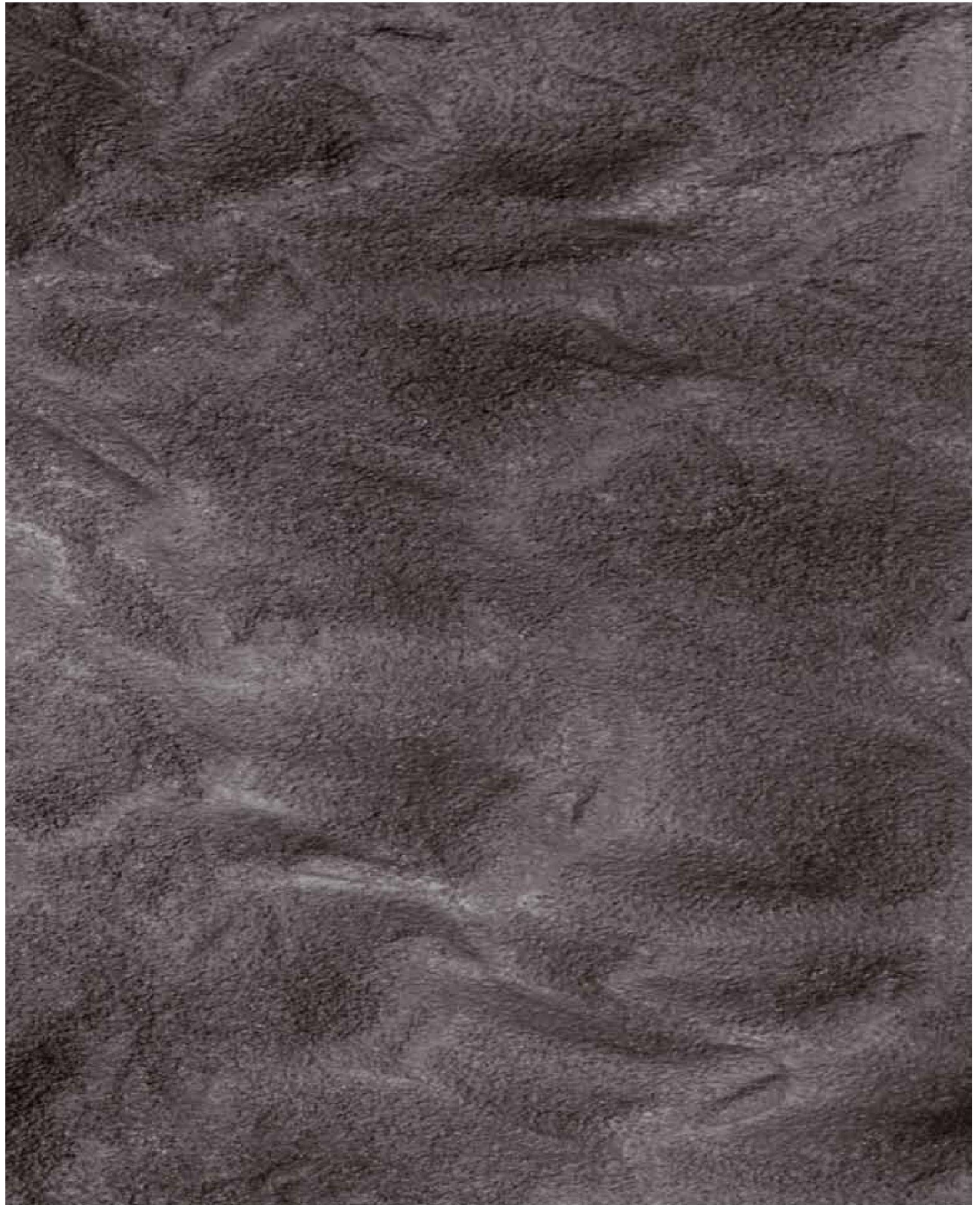
«Erosion I», Teilansicht, Bodeninstallation, 2000-2006, Photographie auf Barytpapier, 18-teilig, je 150cm x 140cm