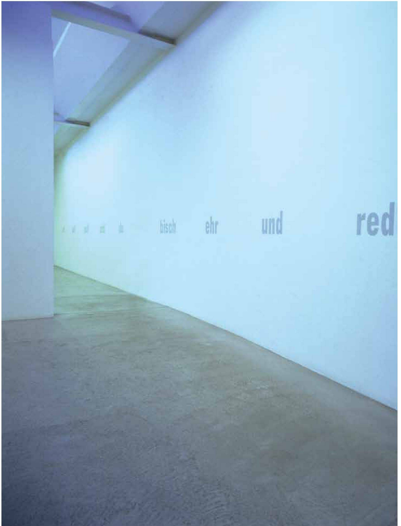
«Auszählreim», 2001, Schriftbilder in verschiedenen Sprachen, Wanddirektauftrag mittels Schablonen, Fotomuseum Winterthur