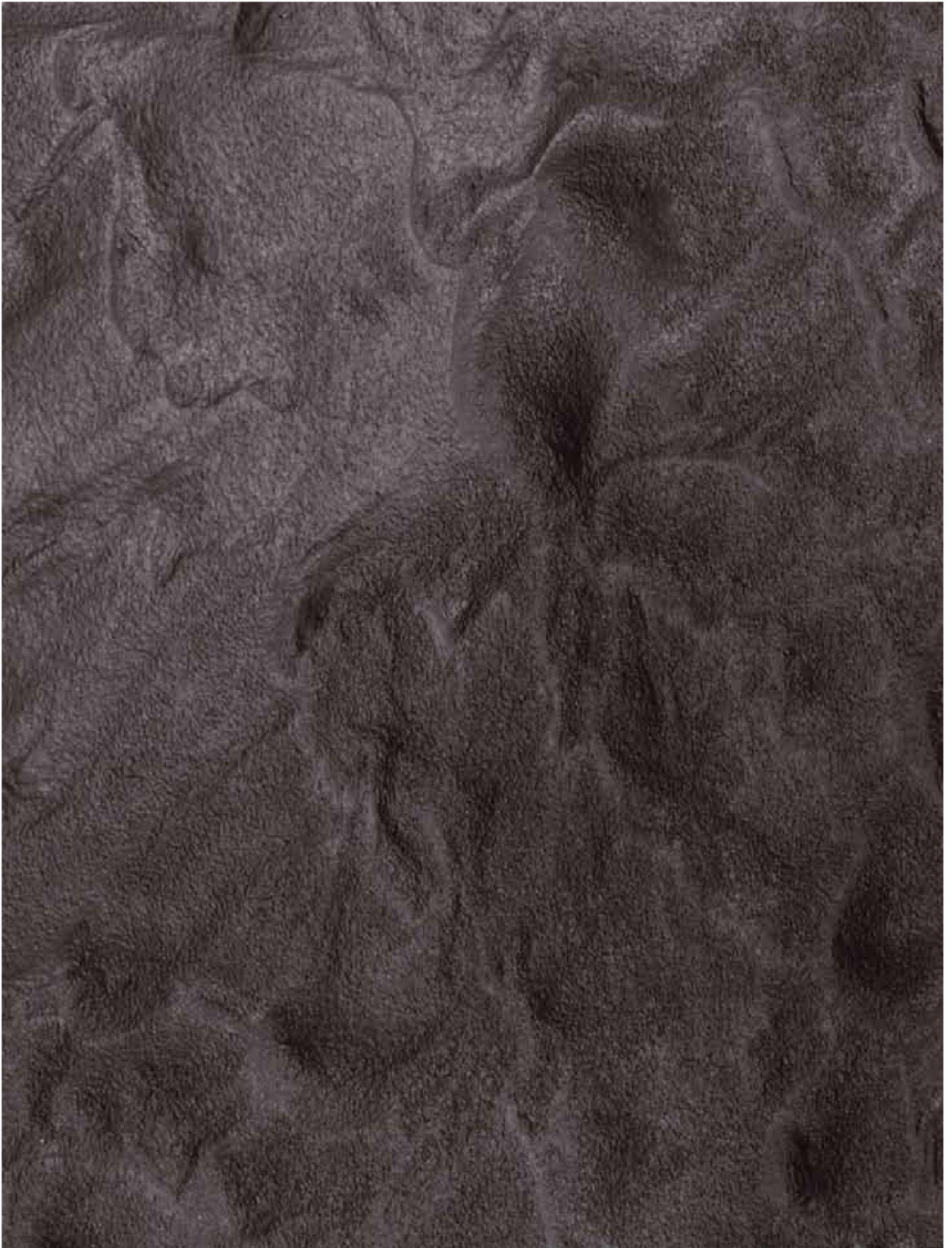
«Erosion I», Teilansicht, Bodeninstallation, 2000-2006, Photographie auf Barytpapier, 18-teilig, je 150cm x 140cm