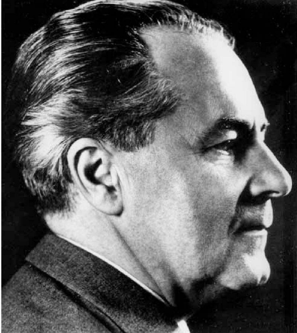
Medard Boss (1903–1990)