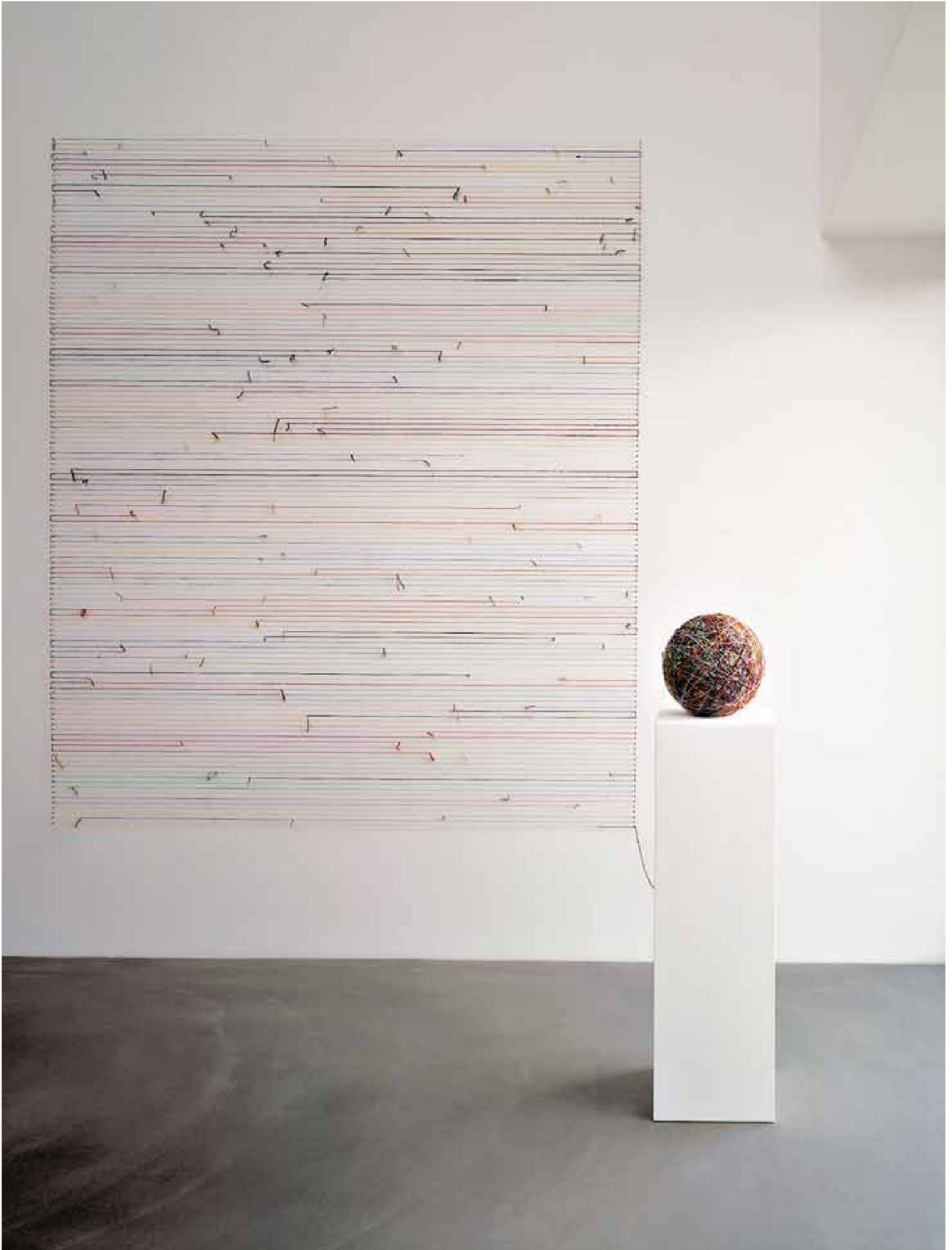
«Abwicklung», Wollknäuel um Nägel abgewickelt, Grösse variabel, Museum Liner, Appenzell, 1999