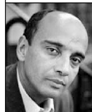
Kwame Anthony Appiah, geboren in London und aufgewachsen in Ghana, bekleidet heute nach Professuren in Yale, Cornell, Duke und Harvard einen Lehrstuhl für Philosophie in Princeton.