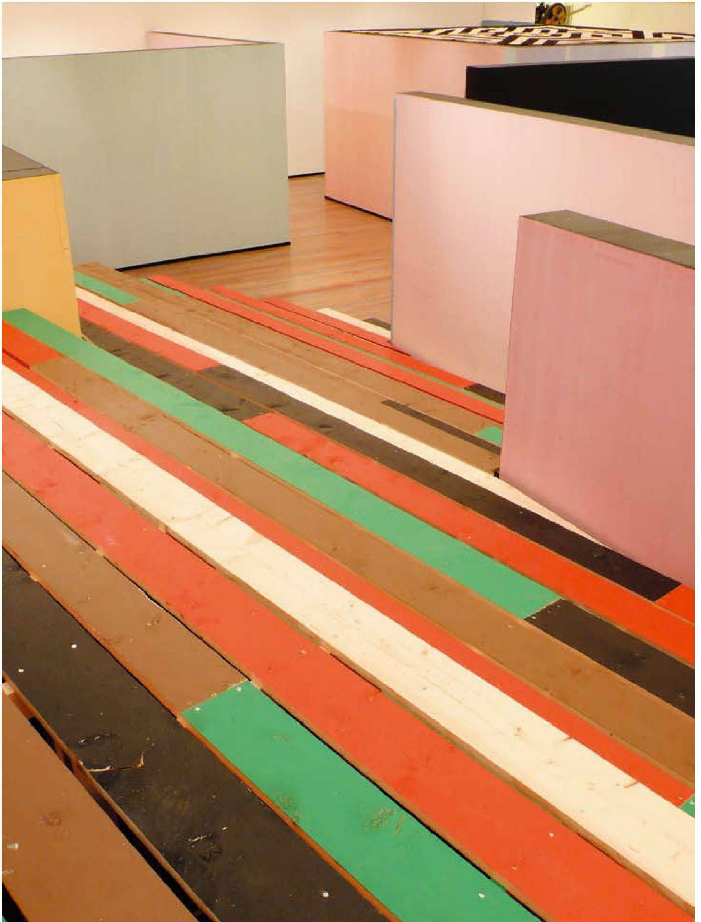
«Minotic Neocolor Mindspace (Secondary African Color Circle)», Acrylfarbe, Holz, Grösse variabel, 2007