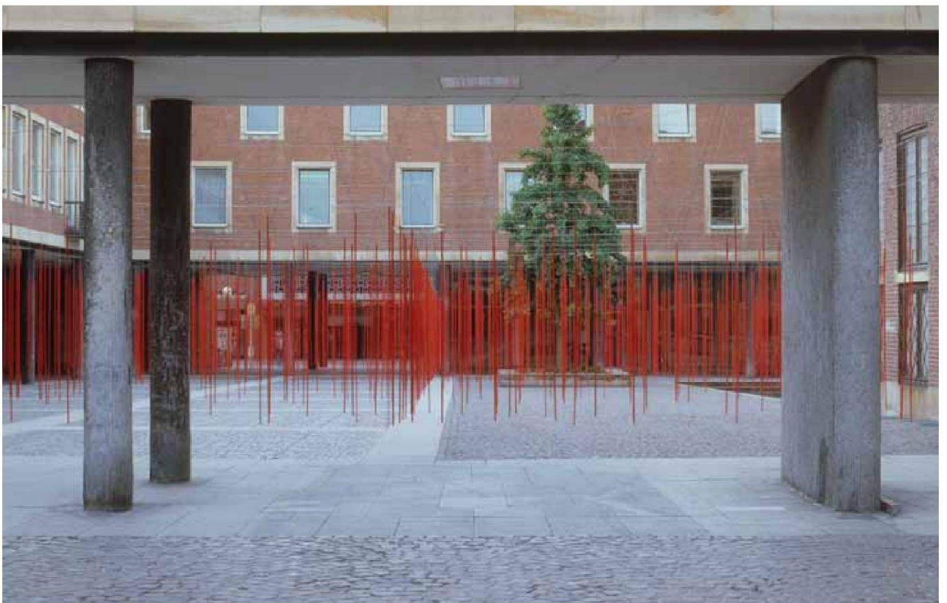
«Parcours», Installation, Münster 1996