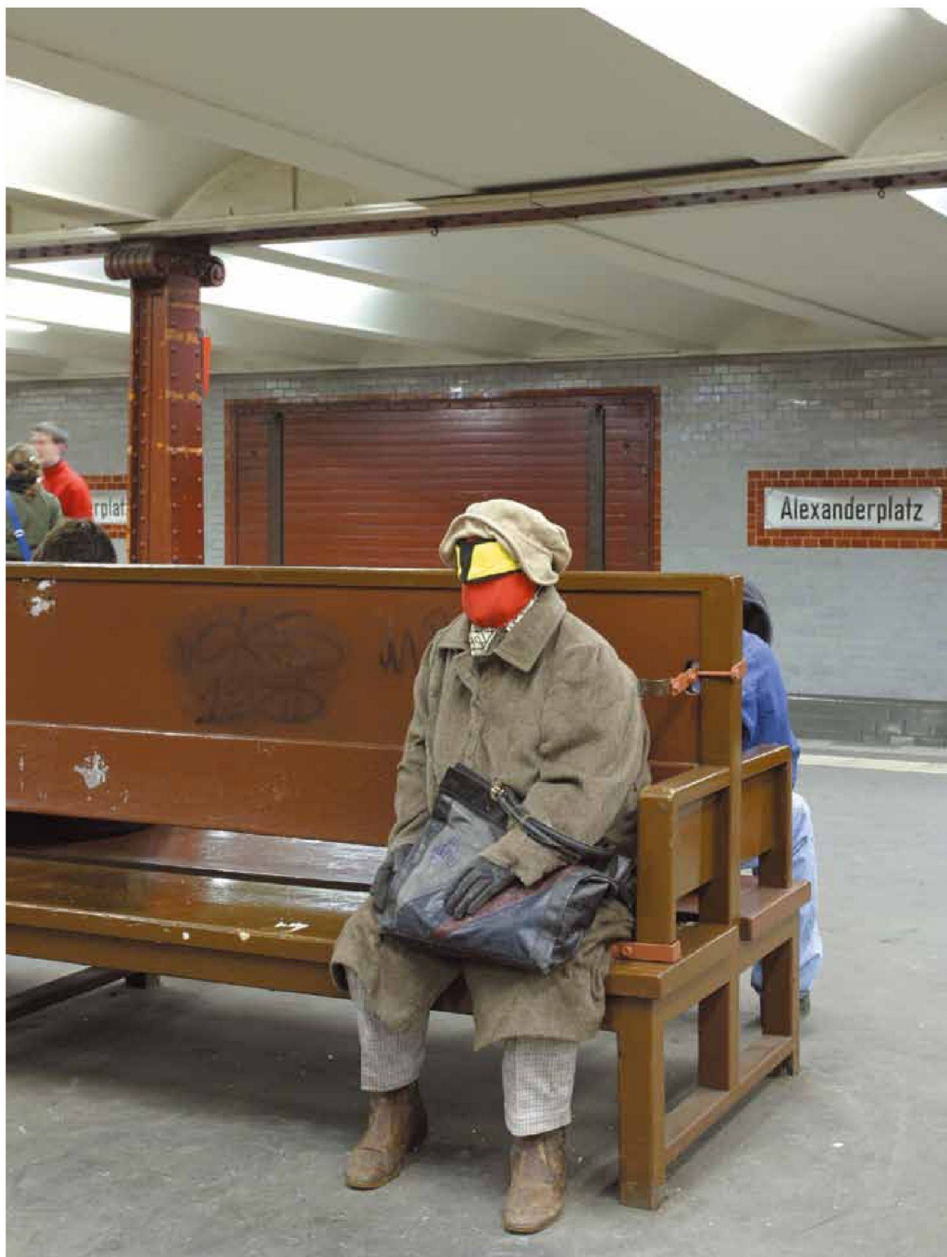
«Superheroes», Kleider, Textilien, Schuhe, Metallgerüst, lebensgross, 2005, U2 Alexanderplatz, Berlin