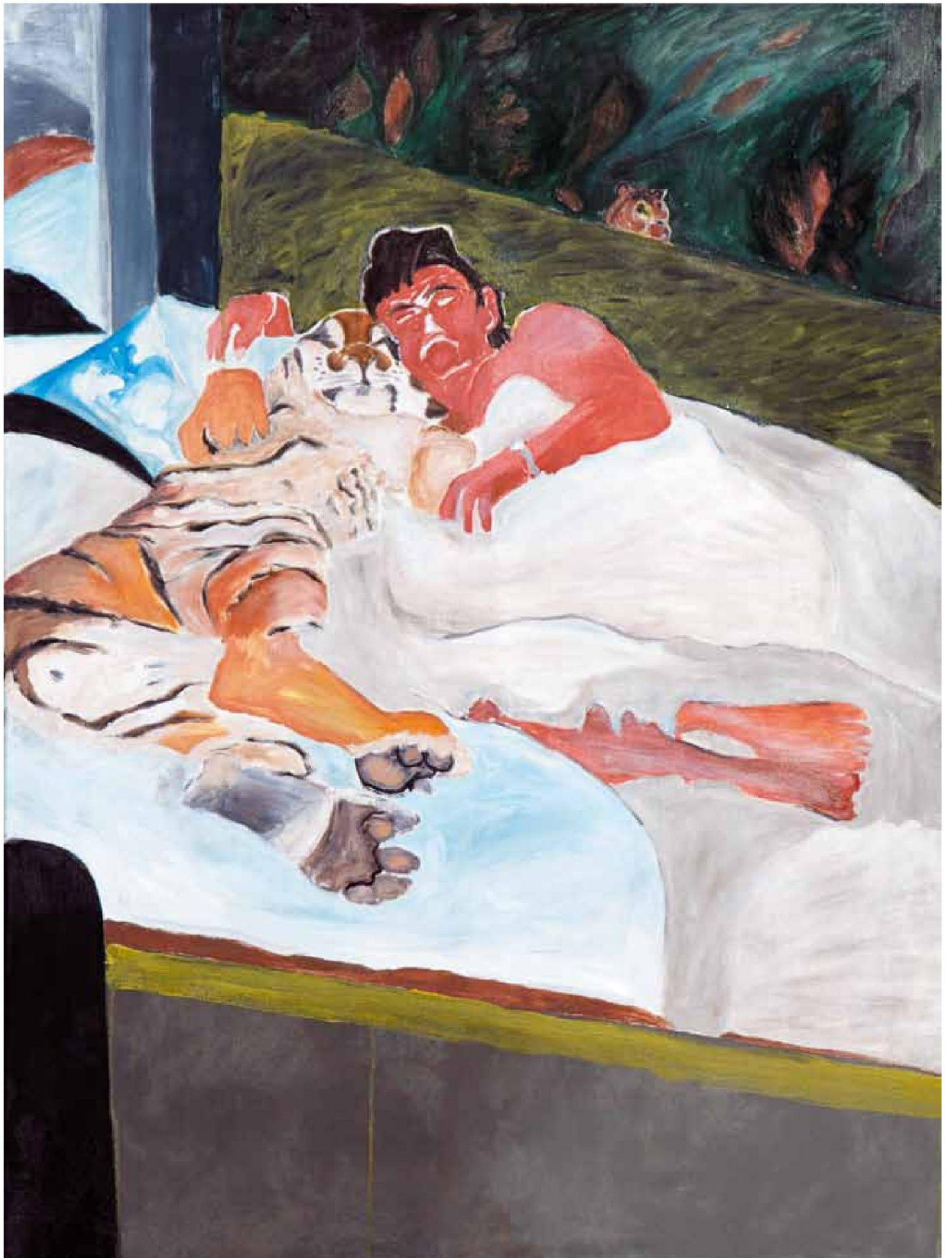
«Riesengrau», Öl/Leinwand, 120 x 60 cm, 2008