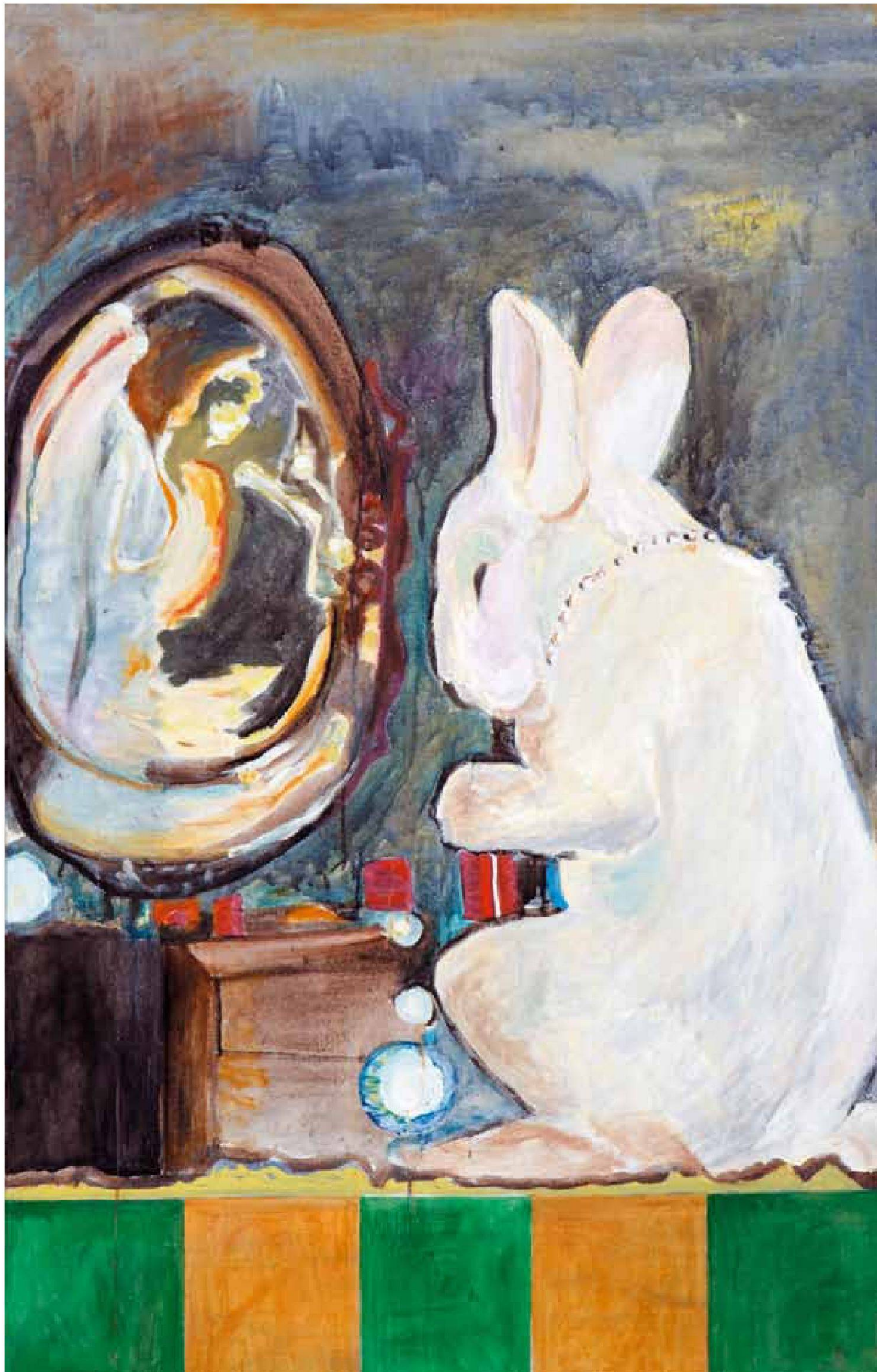
«Hi Blinky», Öl/Leinwand, 140 x 90 cm, 2008