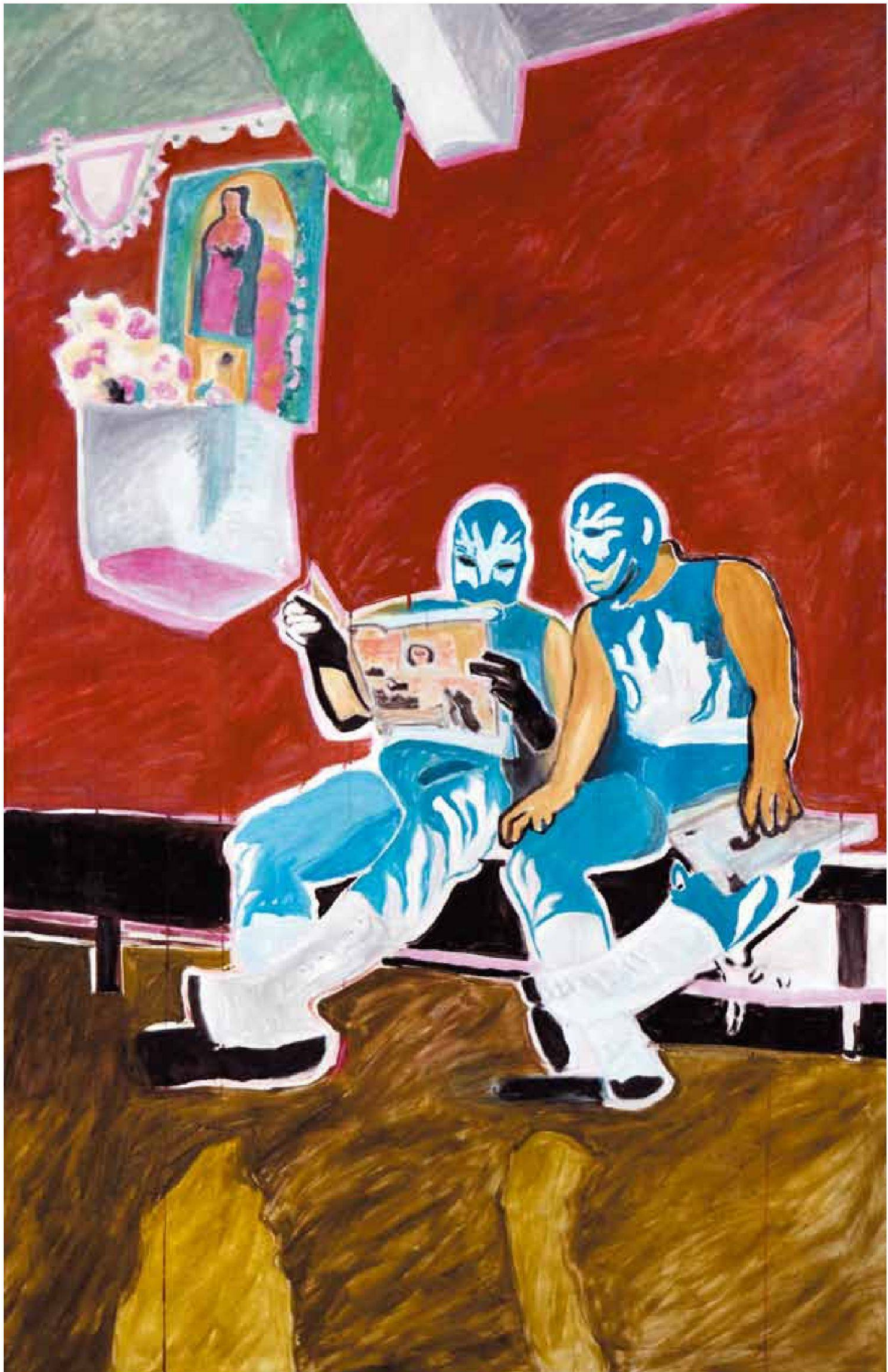
«Tiger and I», Öl/Leinwand, 120 x 90 cm, 2007