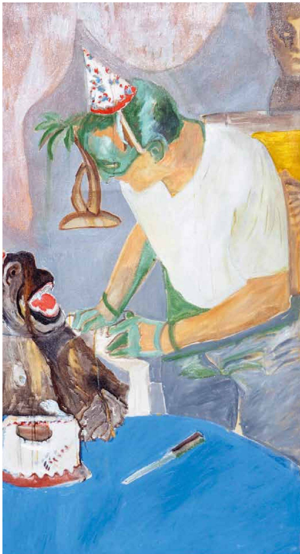
«Cheetha's Geburtstag», Öl/Leinwand, 140 x 150 cm, 2008