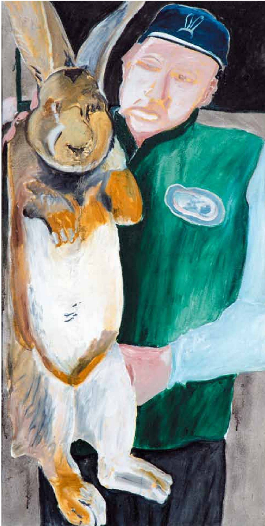
«MgBeth» (in Zusammenarbeit mit der Professur Hovestadt, ETH Zürich), Stoff, Gebläse, ca. 16 x 16 x 4 m, 2007