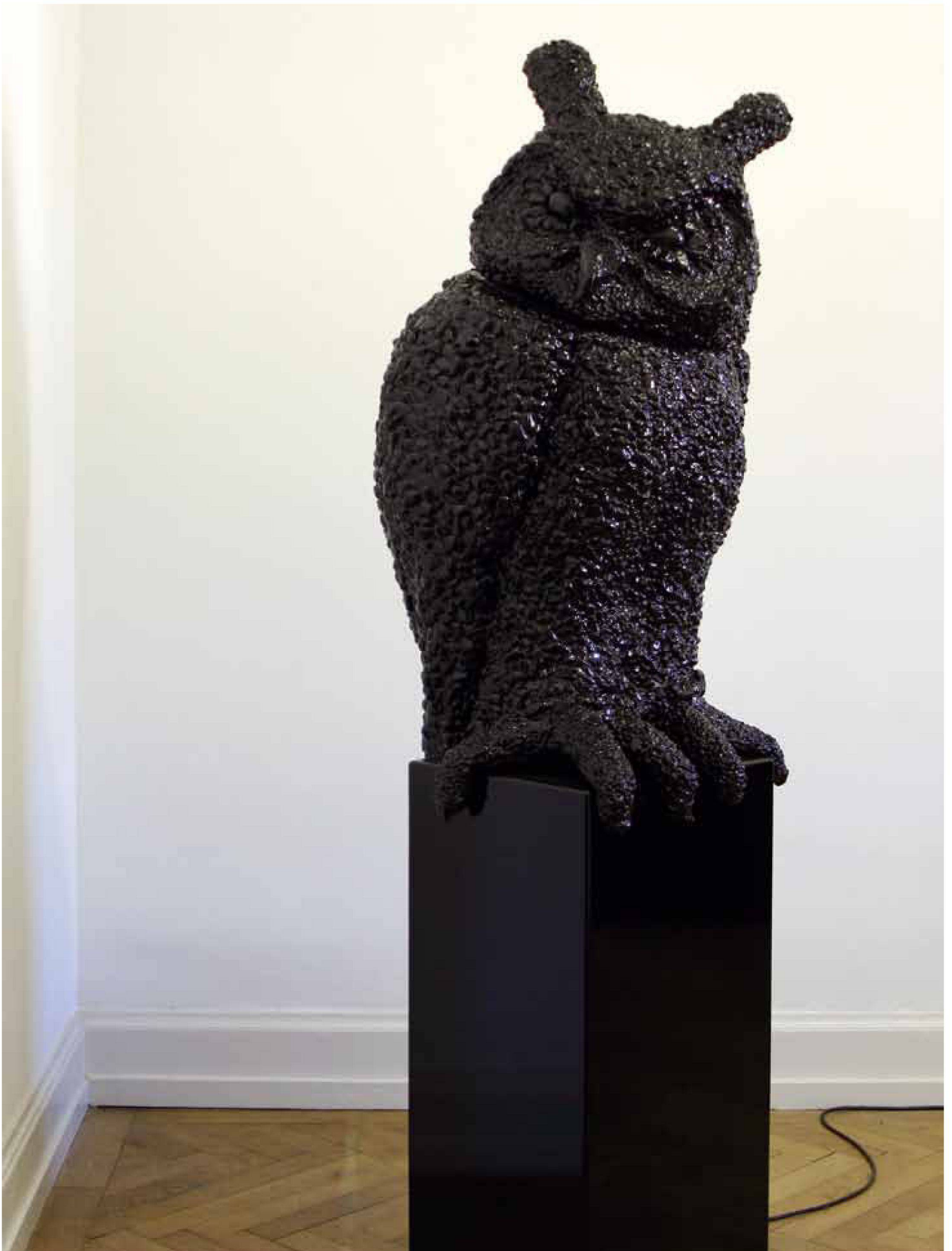
«Hibou», Styropor, Kunstharz, Motor, elektronisch, 195 x 55 x 40 cm, 2006