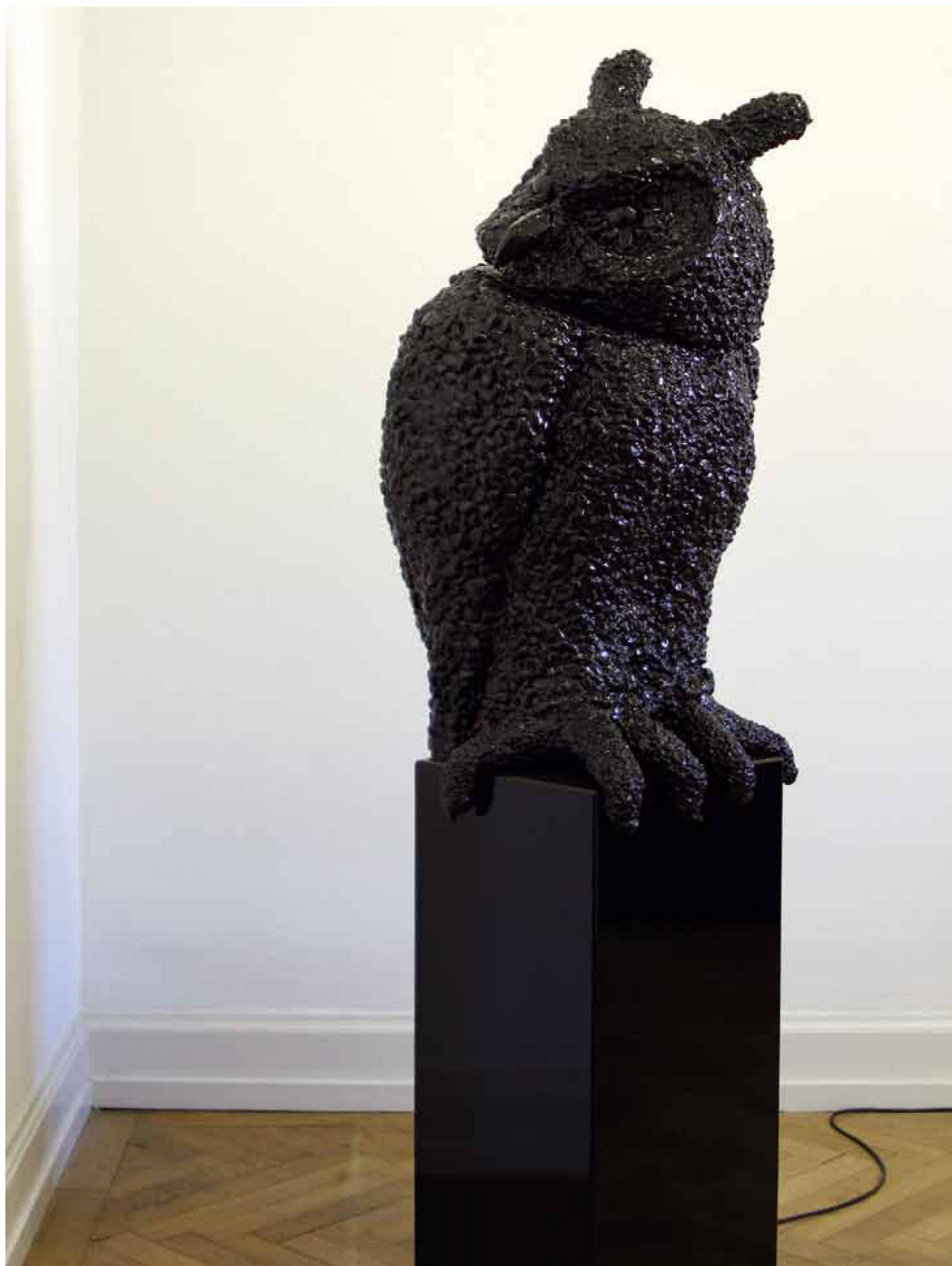
«Hibou», Styropor, Kunstharz, Motor, elektronisch, 195 x 55 x 40 cm, 2006