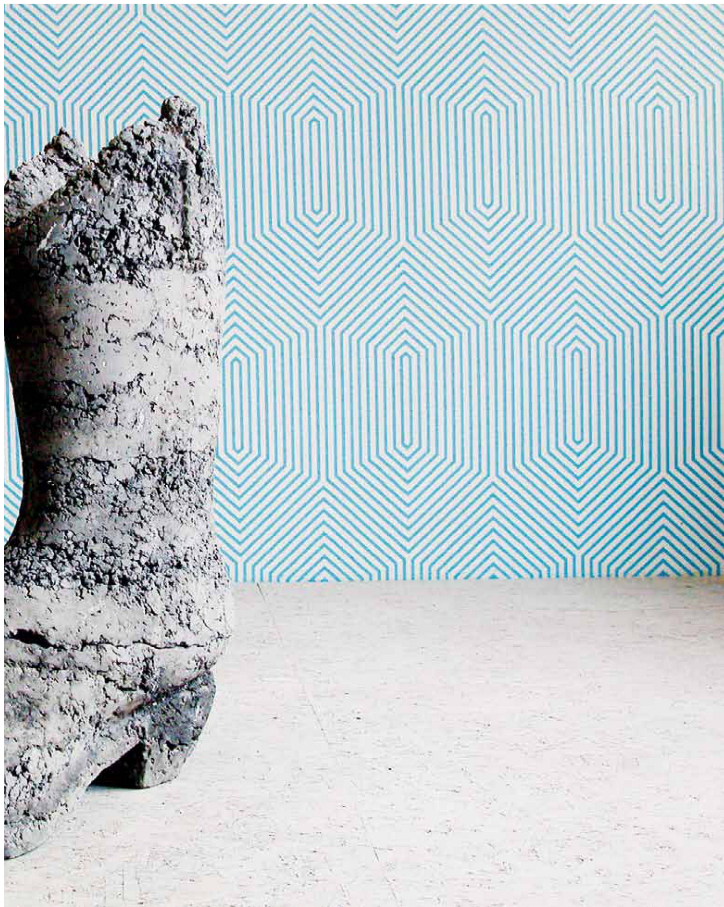
«Honky tonk», Beton, 100 x 30 x 90 cm, 2008