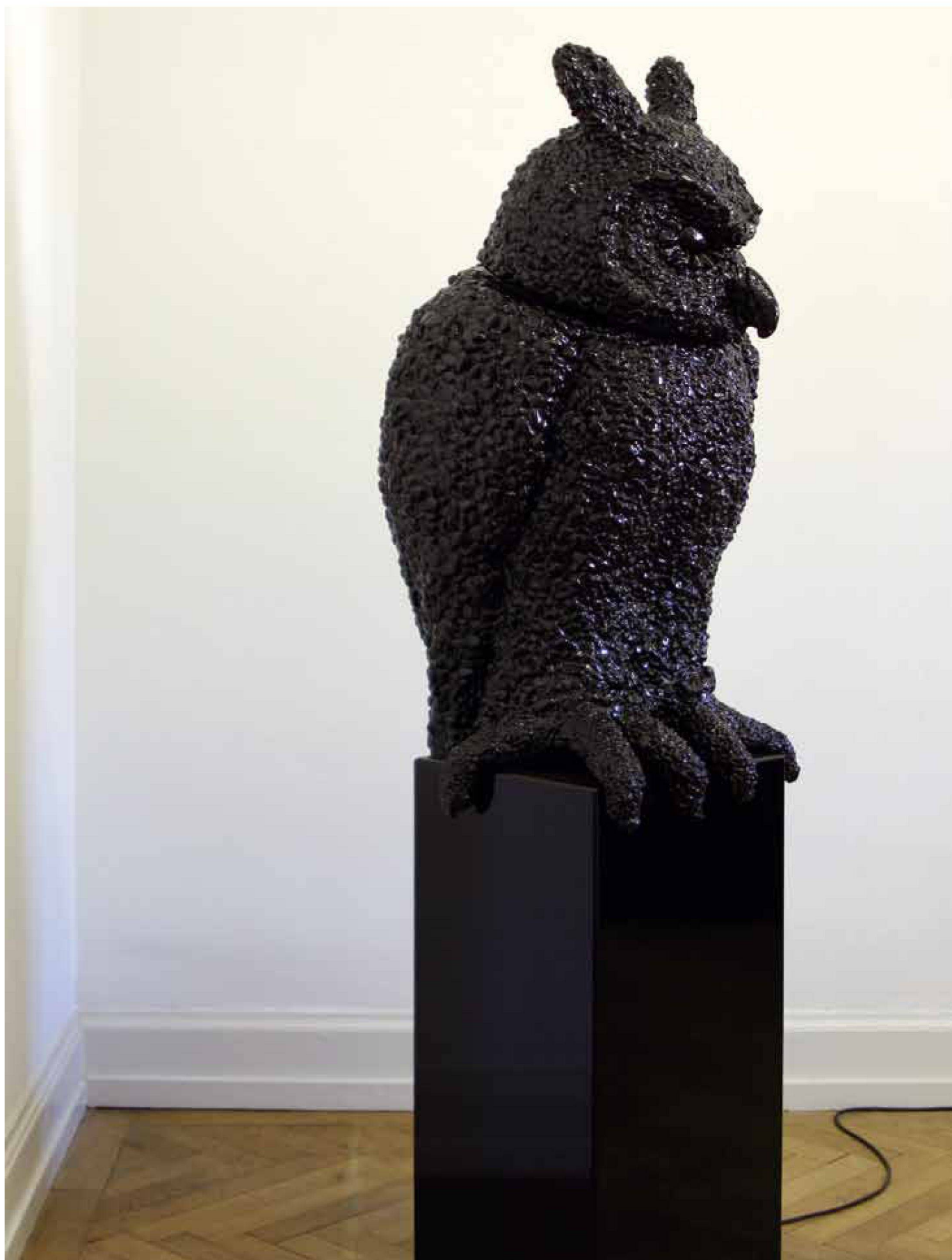
«Hibou», Styropor, Kunstharz, Motor, elektronisch, 195 x 55 x 40 cm, 2006