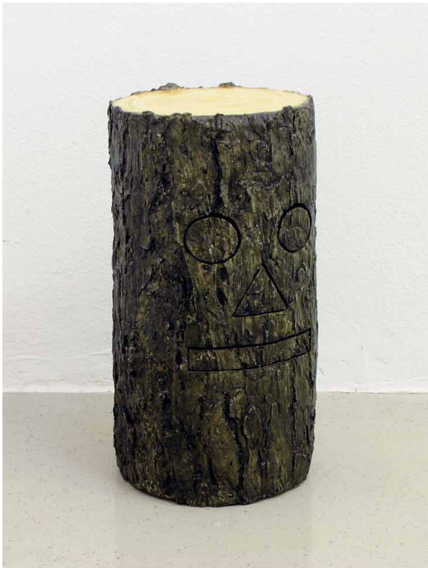
«Tiki», Kunstharz, Styropor, Holz, 40 x 20 x 20 cm, 2008