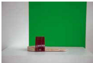
Model 10, 9 Ex., 250 €