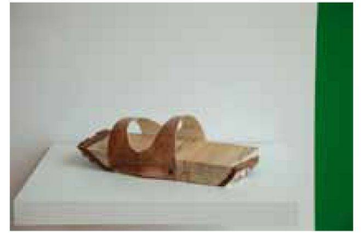
Model 2, 7 Ex., 260 €