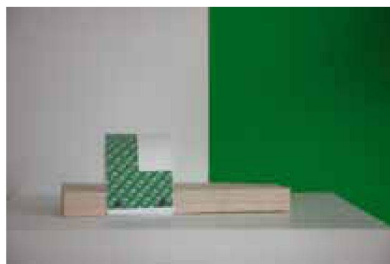
Model 7, 8 Ex., 255 €