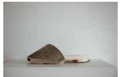
Model 5, 5 Ex., 270 €