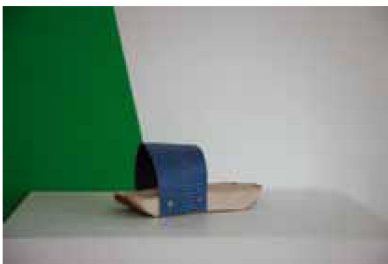
Model 3, 3 Ex., 280 €