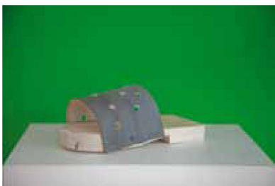
Model 9, 5 Ex., 270 €