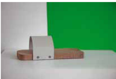
Model 6, 7 Ex., 260 €