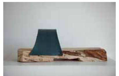
Model 8, 7 Ex., 260 €