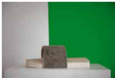
Model 4, 3 Ex., 280 €