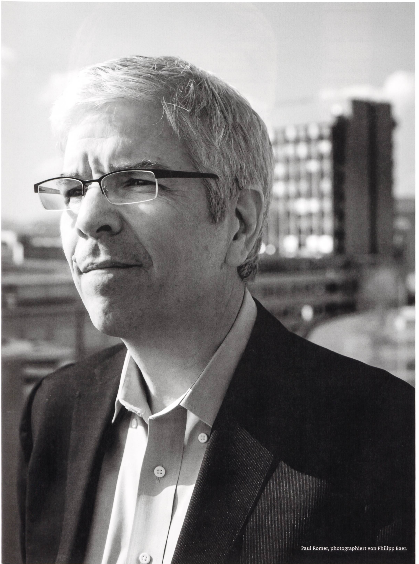
Paul Romer