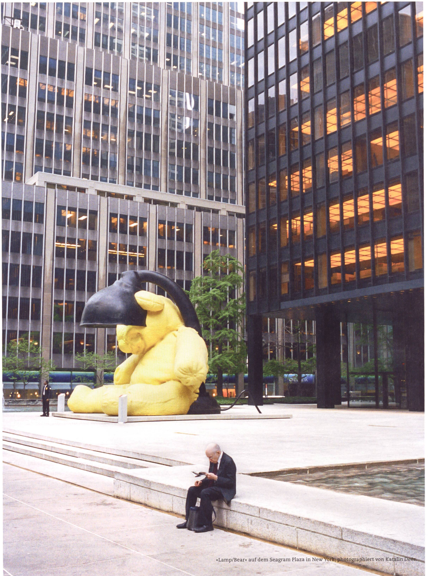
«Lamp/Bear» auf dem Seagram Plaza in New York.