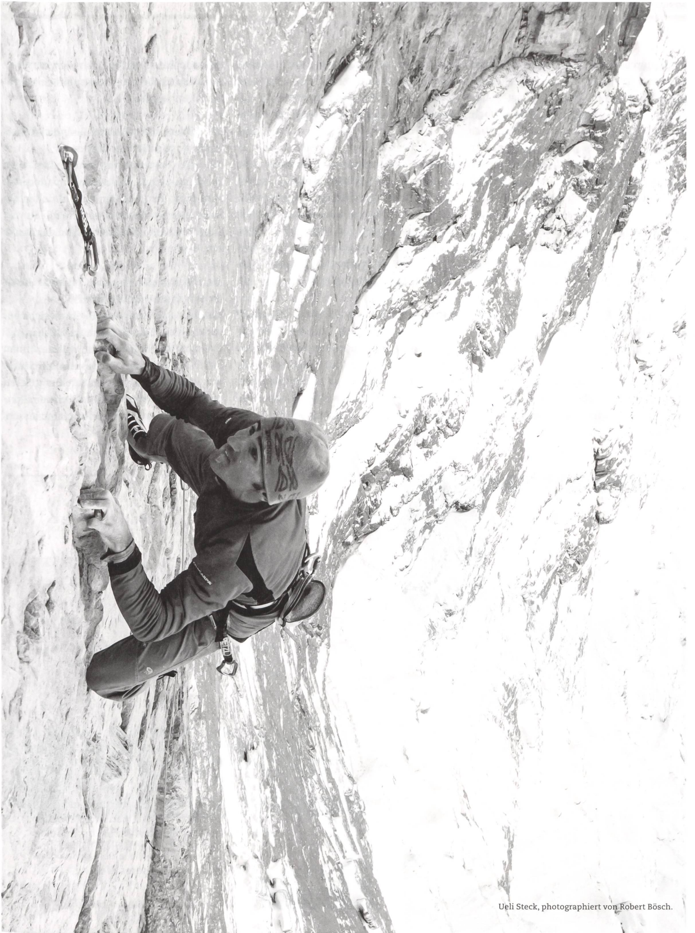
Ueli Steck