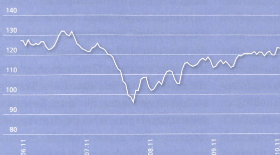
Wertentwicklung in CHF

ISIN: LU0233946184 Valor: 2307462 Bloomberg: VARAKEI LX