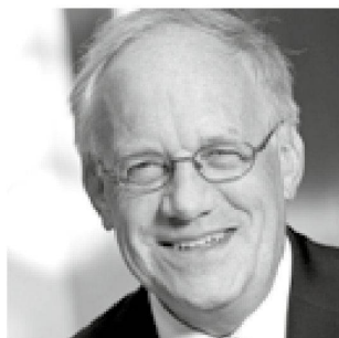
Johann N. Schneider-Ammann Bundesrat, Vorsteher des EVD

Jetzt anmelden! www.europa-forum-luzern.ch