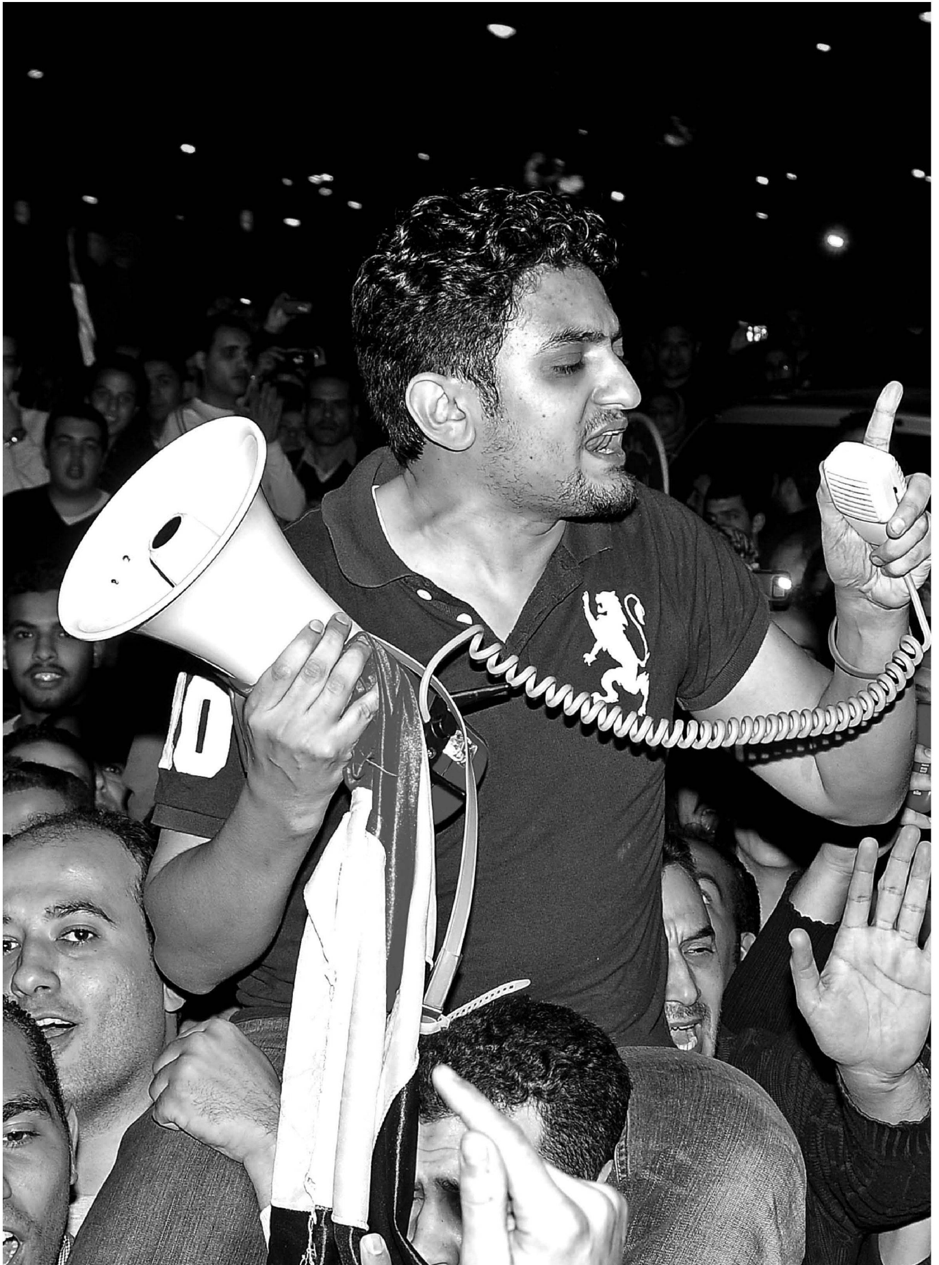
Wael Ghonim in Aktion.