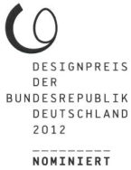
TOUCH DOWN FÜR EINEN ZWISCHENSTOPP