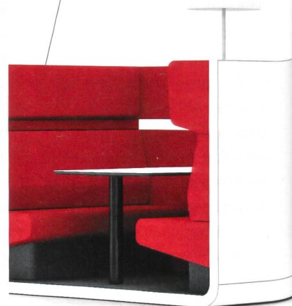
WORK LOUNGE FÜR LOCKERE BESPRECHUNGEN

LO Mindport von Lista Office LO ist das neue Raummöbelsystem, das offene Arbeitswelten strukturiert