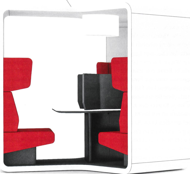
TOUCH DOWN FÜR EINEN ZWISCHENSTOPP