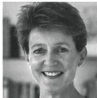
Simonetta Sommaruga Bundesrätin, Vorsteherin des Eidg. Justiz- und Polizeidepartements EJPD

Dienstag, 24. April 2012 09.00 bis 18.00 Uhr